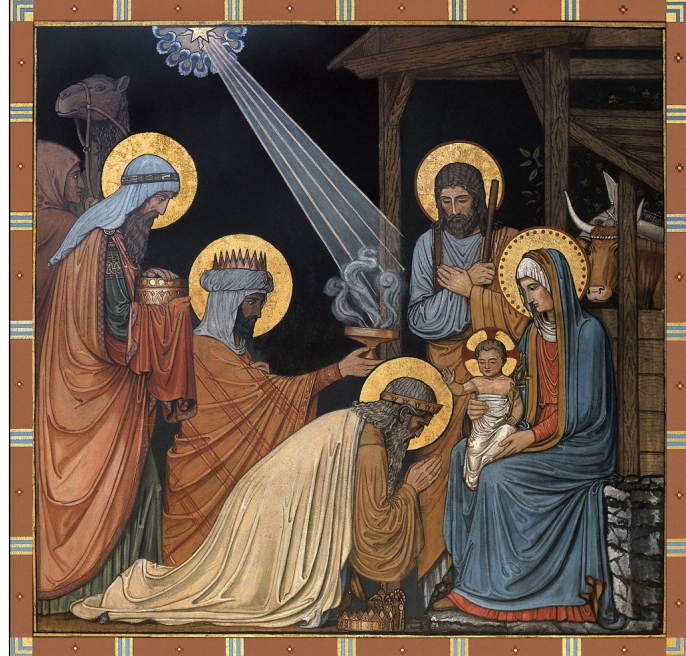
“우리는 동방에서 임금님께 경배하러 왔습니다.”