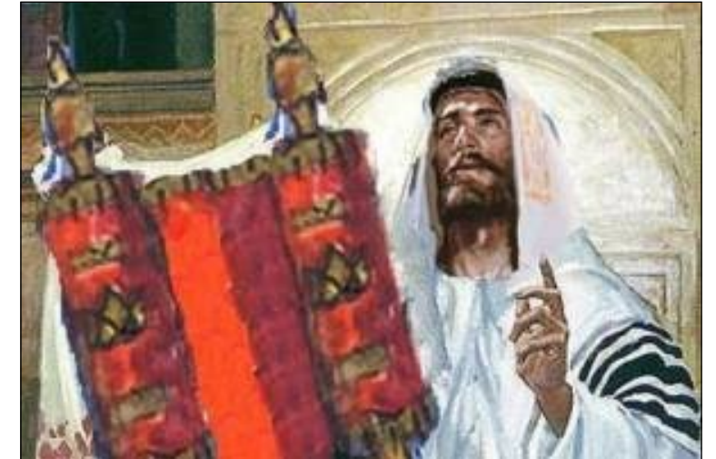
“오늘 이 성경 말씀이 이루어졌다.”