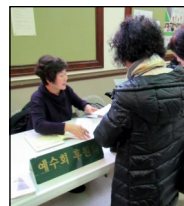
<예수회 Tax Report> 주일 친교실에서 2018년도 예수회 후원금 Tax Report를 전해 드리오니 찾아가시기 바랍니다.