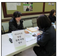
<이냐시오 영성 피정> 2월 13일부터 17일까지 Conyers 수도원에서 있을 피정의 참가 신청을 주일 친교실에서 접수 중입니다.