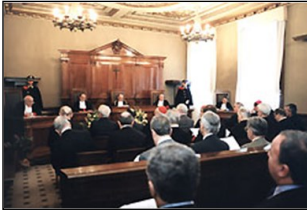
← 바티칸시국 재판정 모습.

— 공의회 정신 담은 개혁적 법률 새로운 사회 변화 질서에 따른 요청 1983년 교황 요한 바오로 2세 반포