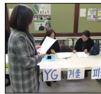
<YG 겨울 피정> 2월 15일부터 17일까지 Life Teen Covecrest Retreat Center에서 피정이 있습니다. 주일 친교실에서 신청을 접수 중입니다.