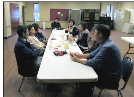
<M.E.> 1월 20일(일) 오후 12시 30분부터 소성당에서 월레모임이 있었습니다.