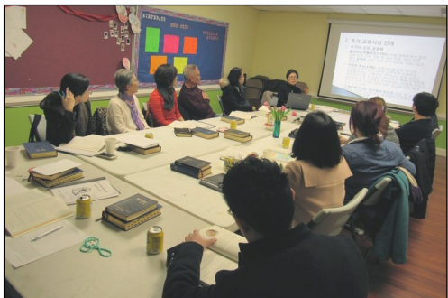
<2019년 부활 영세 교리반> ↑ 매 주일 오후 12시 30분부터 112호실에서 교리반 수업이 있습니다.