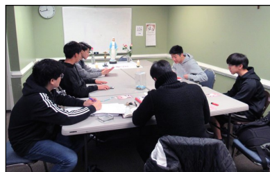
<소년 소녀 레지오 마리아> 매 주일 오전 9시 30분부터 봉당 소년으로 구성된 '셋별' 브레시디움 주회합이 대건 도서관에서 있습니다.