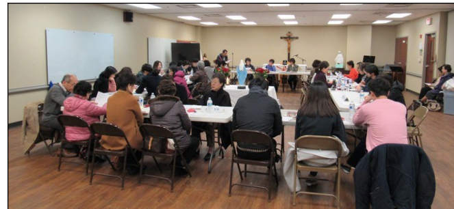
〈꾸리아 월례 회의〉 ↑ 2월 10일(일) 오후 12시 30분부터 소성당에서 2월 월례 회의가 있었습니다. “상아탑” 뿌리시디움과 “만민의 어머니” 뿌리시디움의 발표가 있었고 안건토의, 전달사항등으로 일정이 진행되었습니다.