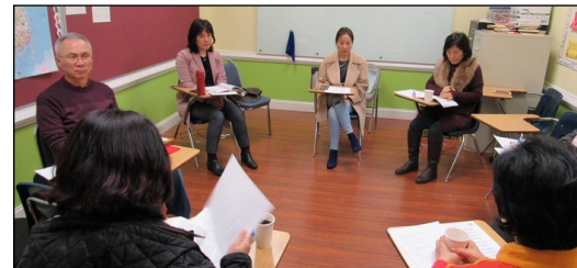
〈성서 그룹공부 봉사자 모임〉 ↑ 2월 10일(일) 오후 12시 30분부터 115호에서 월례모임이 있었습니다.