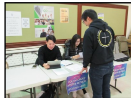
←〈주일학교YG 겨울 피정〉 2월 15일부터 17일까지 YG 겨울 피정이 있습니다. 주일친교실에서 신청을 받고 있습니다.