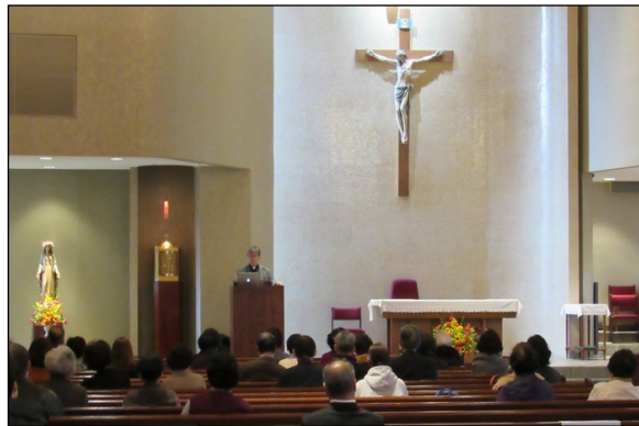
〈사순특강〉 → 2월 10일(일) 오후 1시 30분부터 대성전에서 예수회 김용수(파스칼)신부님께서 “내마음의 외진 곳”이란 주제로 특강이 있었습니다.