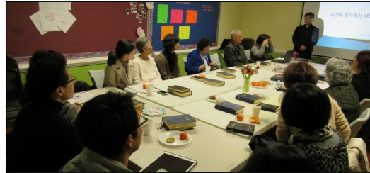
← 〈2019년 부활 영세자 교리반/견진성사 교리반〉 2018년 부활절에 함께 있을 견진성사 교리반 수업이 2월 10일부터 4월 7일까지 8주 동안 매주 일요일 112호에서 있습니다.