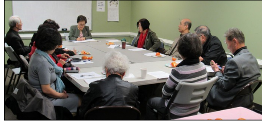
← 〈2019년 부활 영세자 대부모 모임〉 2월 10일(일) 오후 12시 30분부터 대건도서관에서 대부모님 모임이 있었습니다.