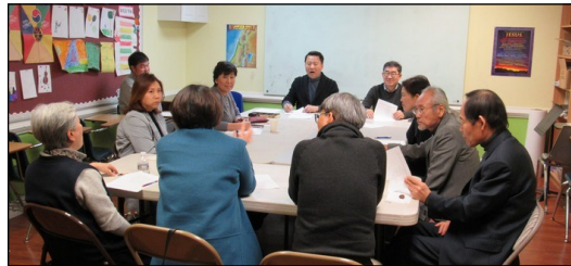
〈구역장 월례모임〉 ↑ 2월 10일(일) 오후 12시 20분부터 110호실에서 월례모임이 있었습니다.