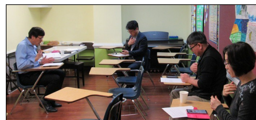
<전례분과 월례 회의> ↑

매주 일요일 오후 12시 30분부터 113호실에서 뜨개질 강좌가 있습니다. 관심있는 분들의 참여바랍니다.