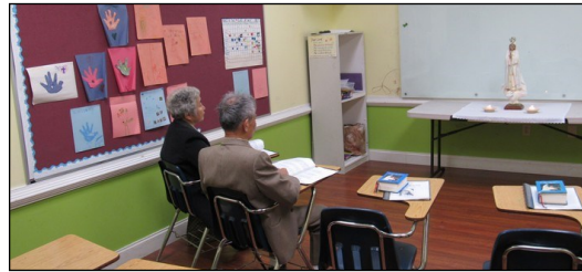
← <다락방 기도회 모임>

매 주일 오후 12시 30분 112호실에서 견진 성사를 위한 교리 수업이 4월 7일까지 있습니다.