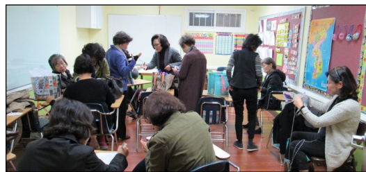
<뜨개질반 모임> ↑

2월 17일(일) 오후 12시 30분부터 소성당에서 월례 모임이 있었습니다.