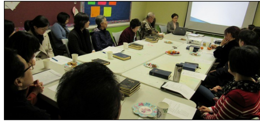
← <2019년 부활 견진 교리반>

2월 17일(일) 오후 12시 30분부터 108호에서 월례 모임이 있었습니다.