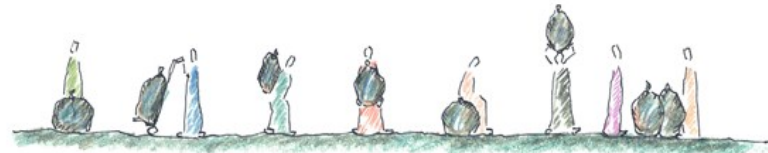
배영길 베드로 신부