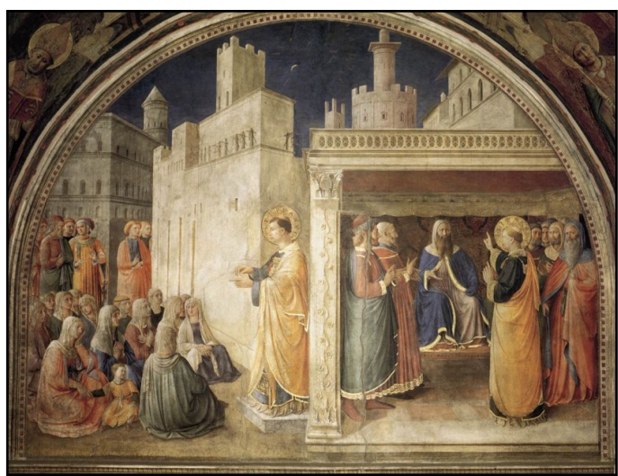
“너희 아버지께서 자비하신 것처럼 너희도 자비로운 사람이 되어라.” 〈루카 6,27-38〉