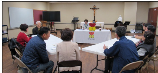
<M.E. 모임> ↑

2월 17일(일) 오후 12시 30분부터 소성당에서 월례 모임이 있었습니다.