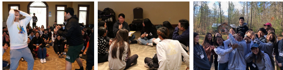
<주일학교 고등부 겨울 피정> ↑

2월 15일(금)부터 2월 17일(일)까지 Covecrest Camp에서 한국 순교자 성당과 성 김대건 성당의 고등부 겨울 피정이 김형철 신부님, 김주찬 신부님, 봉사자들 포함 총 90여명이 함께한 가운데 있었습니다.