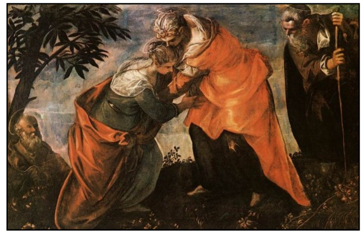
“마음에서 넘치는 것을 입으로 말하는 법이다.” 〈루카 6,39-45〉