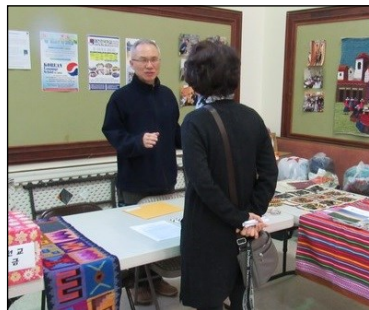
<페루 선교 후원금 및 물품 모집> ↑ 5월 24일부터 6월 5일까지 페루 선교를 떠납니다. 선교에 필요한 후원금과 물품을 모집하오니 교우분들의 많은 도움을 부탁드립니다.