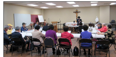
<요셉회 모임> ↑ 3월 24일(일) 오후 12시 15분부터 소성당에서 월례 모임을 있었습니다.