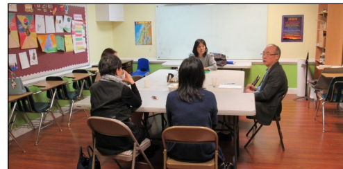
<구역 성경 나눔 봉사자 모임> ↑ 3월 24일(일) 오후 12시 30분부터 110호에서 월례 모임이 있었습니다.