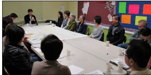
<2019년 부활 견진 교리반 > ↑ 매 주일 오후 12시 30분 112호실에서 견진 성사를 위한 교리 수업이 4월 7일까지 있습니다.