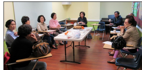
<등대회 모임> ↑ 3월 24일(일) 오후 12시 30분부터 108호실에서 월례 모임이 있었습니다.