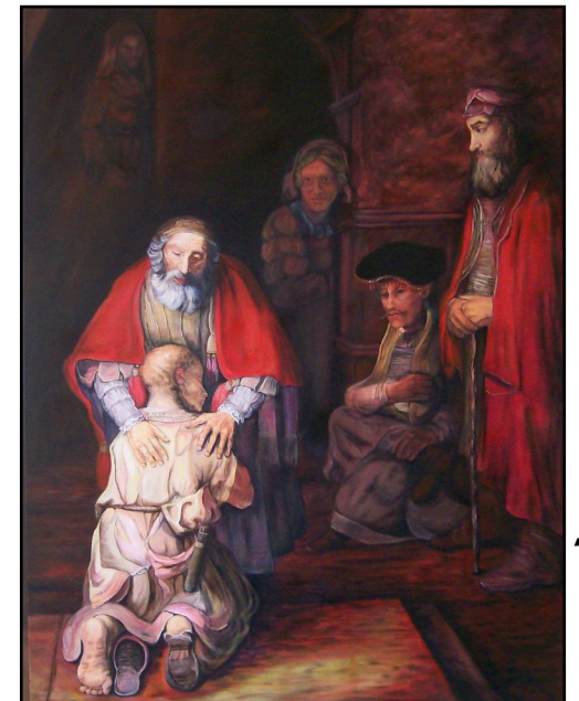
“너의 아우는 죽었다가 다시 살아났다.” <루카 15,1-3.11-32>

성가 입당: 119 봉헌: 210/212 성체: 178/155 파견: 115 제1독서 여호수아기 5,9.10-12 <하느님의 백성은 약속된 땅에 들어가서 파스카 축제를 지냈다.> 화답송 ◎ 주님이 얼마나 좋으신지 너희는 맛보고 깨달아라. 제2독서 코린토 2서 5,17-21 <하느님께서 그리스도를 통하여 우리를 당신과 화해하게 하셨습니다.> 복음환호송 ◎ 말씀이신 그리스도님, 찬미받으소서. ○ 일어나 아버지께 가서 말하리라. 아버지, 제가 하늘과 아버지께 죄를 지었나이다. ◎ 말씀이신 그리스도님, 찬미받으소서. 복음 루카 15,1-3.11-32 <너의 아우는 죽었다가 다시 살아났다.> 영성체송 아들이야, 네 아우는 죽었다가 다시 살아났다. 잃었다가 되찾았으니 기뻐하여라.