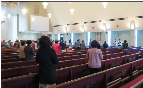
<사순절 십자가의 길 예절 봉헌> ↑ 사순절 기간 중 4월 12일(금)까지 매주 금요일 미사 후 및 주일 오전 9시 50분 대성전에서 십자가의 길 예절이 있습니다. 교우분들의 많은 참석 부탁드립니다.