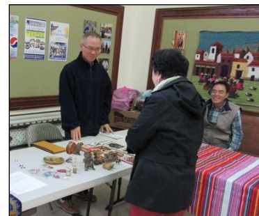
<페루 선교 후원금 및 물품 모집> ↑

5월 24일부터 6월 5일까지 페루 선교를 떠납니다. 선교에 필요한 후원금과 물품을 모집하오니 교우분들의 많은 도움을 부탁드립니다.