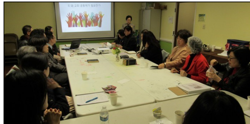
<2019년 부활 견진 교리반 > ↑ 매 주일 오후 12시 30분 112호실에서 견진 성사를 위한 교리 수업이 4월 7일까지 있습니다.