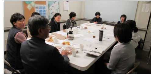
<제대회 모임> ↑ 3월 31일(일) 오후 12시 30분부터 304호실에서 월례 모임이 있었습니다.