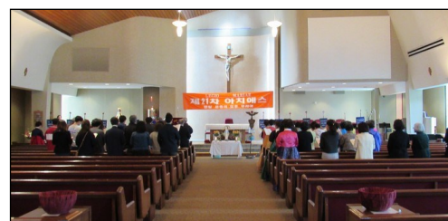
<레지오 마리아 아치에스 행사> ↑ 3월 31일(일) 오후 2시부터 대성전에서 행사가 있었습니다.