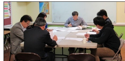
<전례분과 모임> ↑ 3월 31일(일) 오후 12시 30분부터 110호실에서 월례 모임이 있었습니다.