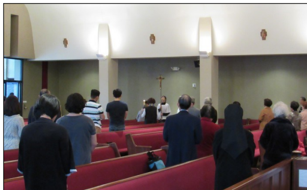
<사순절 십자가의 길 예절 봉헌> ↑ 사순절 기간 중 4월 12일(금)까지 매주 금요일 미사 후 및 주일 오전 9시 50분 대성전에서 십자가의 길 예절이 있습니다. 교우분들의 많은 참석 부탁드립니다.

5월 24일부터 6월 5일까지 페루 선교를 떠납니다. 선교에 필요한 후원금과 물품을 모집하오니 교우분들의 많은 도움을 부탁드립니다.