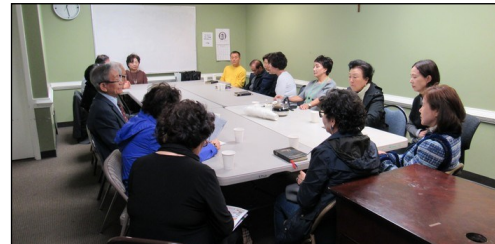
<Marietta 자비반 모임> ↑ 3월 31일(일) 오후 12시 30분부터 대건도서관에서 월례 모임이 있었습니다.