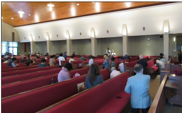
<사순절 십자가의 길 예절 봉헌> ↑ 사순절 기간 중 4월 12일(금)까지 매주 금요일 미사 후 및 주일 오전 9시 50분 대성전에서 십자가의 길 예절이 있습니다. 교우분들의 많은 참석 부탁드립니다.

5월 23일부터 6월 4일까지 페루 비아 엘 살바도르로 선교를 떠납니다. 선교에 필요한 후원금과 물품을 모집하오니 교구분들의 많은 도움을 부탁드립니다.