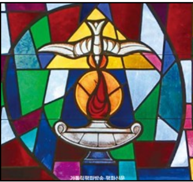
↑ 성령을 상징하는 비둘기와 성사를 의미하는 불꽃을 표현한 색유리화 작품.

개신교에서 세례를 받았는데 가톨릭에서 세례를 다시 받아야 하나요? 비 가톨릭교회에서 세례를 받은 사람이 가톨릭교회에 입교를 원할 경우, 이전에 받은 세례에 중대한 결함이 발견돼 그 유효성에 의문이 가는 경우를 제외하고는 세례를 다시 베풀지 않는다.(교회법 제869조 2항) 그러나 우리나라 개신교의 경우, 세례된 교파에서 주는 세례성사의 유효성이 의심되기에 몇 가지 확인 절차를 거쳐 세례성사 여부를 결정한다. («사목 지침서» 59~62조) 세례성사는 그리스도께 속해 있음을 나타내는 지위지 않는 영적 표지(인호)를 새겨 줍니다. 그래서 이 성사는 일생에 단 한 번만 받을 수 있습니다. 그러나 비 가톨릭교회에서 세례를 받은 사람의 경우 그 세례가 유효한지 확실하지 않기에 유효한 세례로 인정받기 위해서는 확인 절차를 거쳐야 합니다. 교회의 뜻에 따라 규정된 대로 행하고자 하는 의향을 가지고, 물로 씻는 예식이든 침례식이든 “성부와 성자와 성령의 이름으로” 세례를 받았는지 확인이 되어야 합니다.(교회법 제869조 2항) 이렇게 유효한 절차에 따라 세례를 받았다 하더라도 개신교와 천주교의 교리에 차이가 있으므로 예비신자 교리를 배울 필요가 있고 개신교에 없는 예절들이 있으므로 보충 예식을 해야 합니다. 유효하게 세례받은 비 가톨릭 신자가 가톨릭교회에 입교하고자 할 때 그들의 세례가 합당한 방식으로 이루어진 세례라면 다시 세례를 받을 필요가 없고, 「어른 입교 예식」에 규정된 ‘일치 예식’만 하면 됩니다. («사목 지침서» 62조)