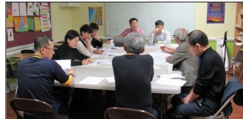
<구역장 월례모임> ↑ 4월 7일(일) 오후 12시 20분부터 110호실에서 월례모임이 있었습니다.