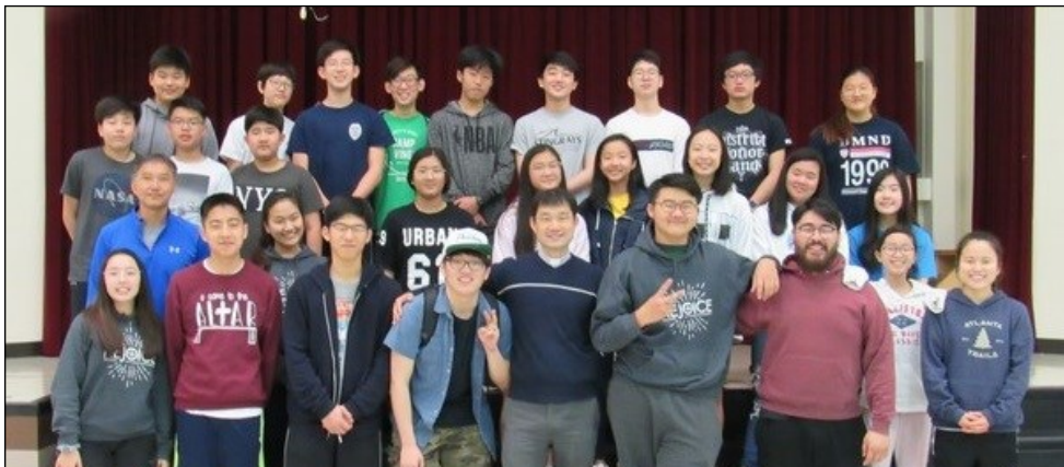
<중등부 Lock-in> ↑ 4월 5일(금) 오후 7시부터 4월 6일(토) 오전 11시까지 중등부 Lock-in이 분당에서 있었습니다.