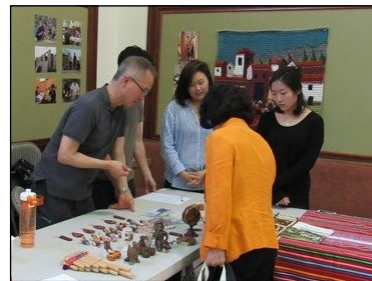
<페루 선교 후원금 및 물품 모집> ↑

5월 23일부터 6월 4일까지 페루 비아 엘 살바도르로 선교를 떠납니다. 선교에 필요한 후원금과 물품을 모집하오니 교구분들의 많은 도움을 부탁드립니다.