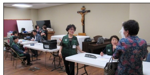
<성 루가 의료봉사회 진료> ↑ 4월 7일(일) 오후 12시 30분에 소성당에서 4월도 정기 진료가 있었습니다. 진료를 원하시는 분들은 복용하고 계신 약병을 지참해 주시면 진료시 도움이 되오니 참조바랍니다.