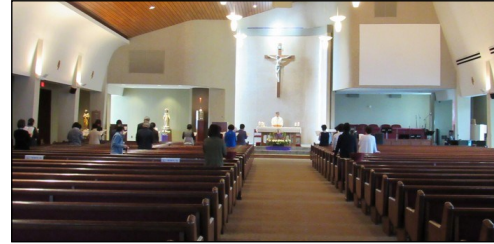
<성모 신심 미사> ↑ 4월 6일(토) 오후 12시에 대성전에서 성모 신심 미사가 봉헌되었습니다.