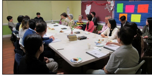
<2019년 부활 견진 교리반 > ↑ 매 주일 오후 12시 30분 112호실에서 견진 성사를 위한 교리 수업이 4월 7일 까지 있습니다.