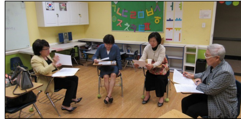
<사회복지분과 모임> ↑ 4월 7일(일) 오후 12시 30분부터 유아 방호에서 모임을 있었습니다.