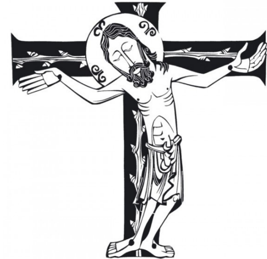
우리 주 예수 그리스도의 수난기 <루카 22,14-23,56>

성 가 입당: 119 봉헌: 216/219 성체:168/169 파견:115 제 1 독서 이사야서 50,4-7 <나는 모욕을 받지 않으려고 내 얼굴을 가리지도 않았다. 나는 부끄러운 일을 당하지 않을 것임을 안다(‘주님의 종’의 셋째 노래).> 화답송 ◎ 하느님, 저의 하느님, 어찌하여 저를 버리셨나이까? 제 2 독서 필리피서 2,6-11 <그리스도께서는 당신 자신을 낮추셨습니다. 그러므로 하느님께서도 그분을 드높이 올리셨습니다.> 복음환호송 ◎ 그리스도님, 찬미와 영광 받으소서. ○ 그리스도는 우리를 위하여 죽음에 이르기까지, 십자가 죽음에 이르기까지 순종하셨네. 하느님은 그분을 드높이 올리시고 모든 이름 위에 뛰어난 이름을 주셨네. ◎ 그리스도님, 찬미와 영광 받으소서. 복음 루카 22,14-23,56 <우리 주 예수 그리스도의 수난기> 영성체송 아버지, 이 잔을 비켜 갈 수 없어 제가 마셔야 한다면, 아버지의 뜻이 이루어지게 하소서.