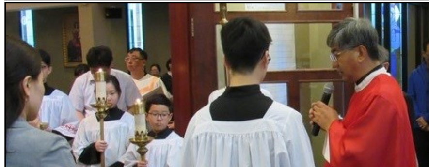
<주님 수난 성지 주일 미사 > ↑ 4월 13일(토) 특전 미사와 14일(일) 오전 8시 30분 및 10시 30분 미사는 주님 수난 성지 주일 미사로 봉헌 되었습니다.