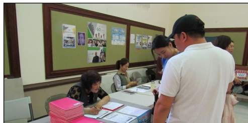
<2019년 여름학교 > ↑ 주일 친교실에서 K~5th Grade 여름학교 등록 접수를 받고 있습니다.