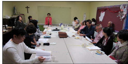
<성인 예비 신자 수련식 > ↑ 4월 14일(일) 오후 12시 15분부터 예비 신자와 대부모님의 수련식이 112호실에서 있었습니다.