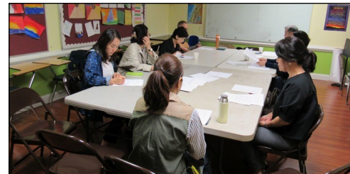
<성서 그룹공부 봉사자 모임 > ↑ 4월 14일(일) 오후 12시 30분부터 110호에서 월례 모임이 있었습니다.