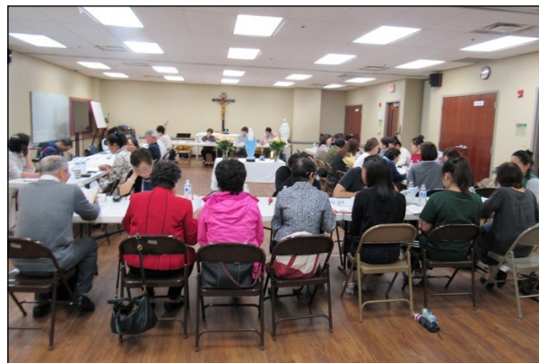
<꾸리아 월례 회의 > ↑ 4월 14일(일) 오후 12시 30분부터 소성당에서 4월 월례 회의가 있었습니다. "황금 궁전", "사랑하올 어머니" 뿌리시디움의 발표가 있었고 안전토의, 전달사항등으로 일정이 진행되었습니다.