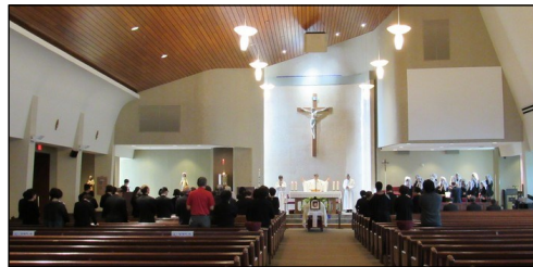
<장례 미사 > ↑ 故 민복실(유리아나)님의 장례미사가 4월 13일(토) 오후 12시에 본당 신부님 집전으로 대성전에서 있었습니다.