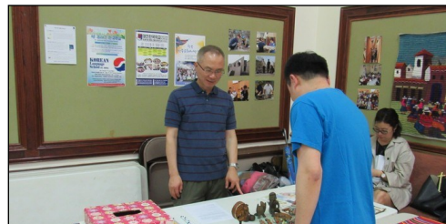
<페루 선교 후원금 및 물품 모집 > ↑ 5월 23일부터 6월 4일까지 페루 비아 엘살바도르 선교를 떠납니다. 선교에 필요한 후원금과 물품을 모집하오니 교우분들의 많은 도움을 부탁드립니다.