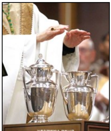
↑ 교회는 견진성사 예식 때 성령의 부여를 더 잘 드러내고자 안수에 축성 성유를 바르는 예식을 추가했다. 사진은 성유를 축성하는 모습. [CNS 자료사진]