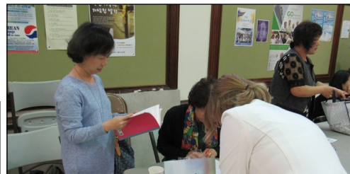
<사순 시기 은총 성경쓰기 > ↑ 4월 14일(일) 친교실에서 사순기간 동안 교우분들께서 정성스럽게 써주신 성경쓰기 노트를 접수했습니다.