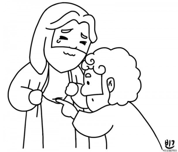
여드레 뒤에 예수님께서 오셨다. <요한 20,19-31>

성 가 입당: 132 봉헌:215/220 성체:165/499 파견: 134 제 1 독 서 사도행전 5,12-16 <주님을 믿는 남녀 신자들의 무리가 더욱 더 늘어났다.> 화 답 송 ◎ 주님은 좋으신 분, 찬송하여라. 주님의 자애는 영원하시다. 제 2 독 서 요한 묵시록 1,9-11.12-13.17-19 <나는 죽었지만, 보라, 영원무궁토록 살아 있다.> 복음환호송 ◎ 알렐루야. ◎ 주님이 말씀하신다. 토마스야, 너는 나를 보고서야 믿느냐? 보지 않고도 믿는 사람은 행복하다. ◎ 알렐루야. 복 음 요한 20,19-31 <여드레 뒤에 예수님께서 오셨다.> 영 성 체 송 네 손을 넣어 못 자국을 확인해 보아라. 의심을 버리고 믿어라. 알렐루야.