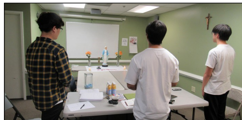
<소년 소녀 뿌리시디움 모임> ↑ 매주 일요일 오전 9시 30분부터 본당 소년 소녀로 구성된 '셋별' 뿌리시디움 모임이 대건도서관에서 있습니다.