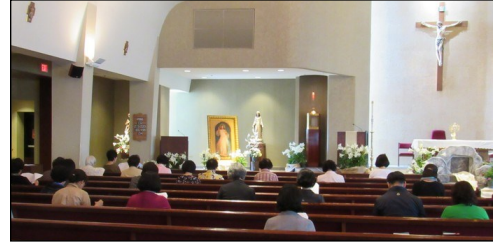
<자비의 축일 행사> ↑ 4월 28일(일) 오후 2시부터 대성전에서 행사가 있었습니다.