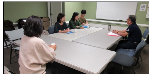
<구역 성경 나눔 봉사자 모임> ↑ 4월 28일(일) 오후 12시 30분부터 108호실에서 월례 모임을 있었습니다.