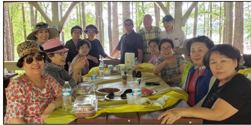
<등대회 모임> ↑ 등대회에서는 4월 28일(일) 오전 10시 30분부터 Fort Yargo Park에서 회원 15명이 모여 청명한 날씨를 즐기며 친교를 나누었습니다.