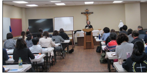
<창세기 연수> ↑ 4월 27일(토)과 28일(일) 이틀에 걸쳐 창세기 연수가 소성당에서 있었습니다.