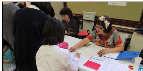
<2019년 여름학교> ↑ 주일 친교실에서 K~5th Grade 여름학교 등록 접수를 받고 있습니다.