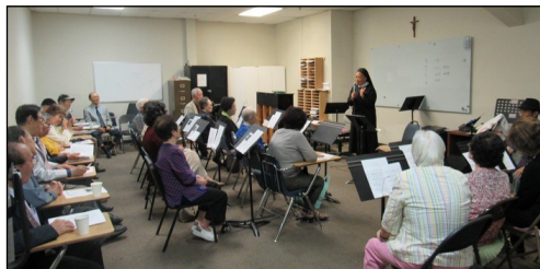
<요셉회 모임> ↑ 4월 28일(일) 오후 12시 15분부터 성가대실에서 월례 모임을 있었습니다.