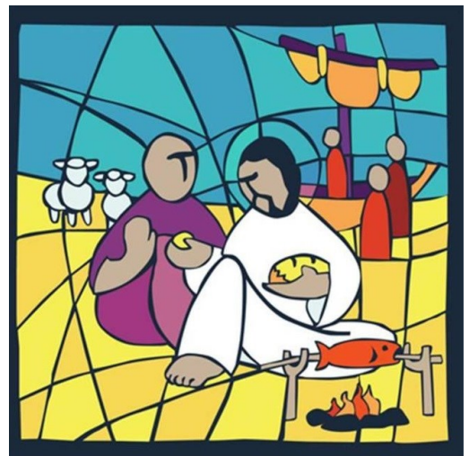
예수님께서서는 다가가셔서 빵을 들어 그들에게 주시고 고기도 주셨다. <요한 21, 1-19>

성 가 입당:138 봉헌: 340,510 성체:159,172 파견:135 제 1 독 서 사도행전 5,27-32. 40-41 < 우리는 이 일의 증인입니다. 성령도 증인이십니다. > 화 답 송 ◎ 주님, 저를 구하셨으니 당신을 높이 기리나이다. 제 2 독 서 요한 묵시록 5,11-14 < 살해된 어린양은 권능과 부를 받기에 합당하십니다. > 복음환호송 ◎ 알렐루야. ○ 만물을 지으신 그리스도 부활하시고 모든 사람에게 자비 를 베푸셨네. ◎ 알렐루야. 복 음 요한 21,1-19 < 예수님께서서는 다가가셔서 빵을 들어 그들에게 주시고 고기도 주셨다. > 영 성 체 송 예수님이 제자들에게 “와서 먹어라.” 하시며, 빵을 들어 그들에게 주셨네. 알렐루야.