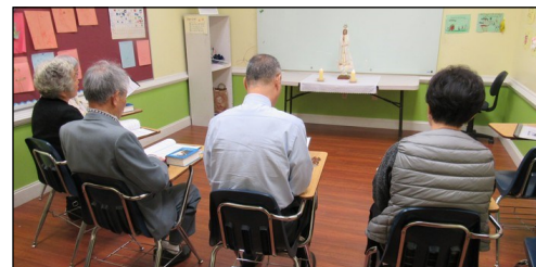
<다락방 기도회 모임> ↑ 매주 일요일 오전 9시 114호에서 다락방 기도 모임을 갖고 있습니다. 관심있는 교우들의 많은 참여 부탁드립니다.