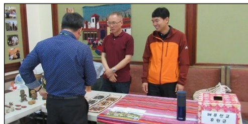
<페루 선교 후원금 및 물품 모집> ↑ 선교에 필요한 후원금과 물품을 모집 하오니 교구분들의 많은 도움을 부탁드립니다.