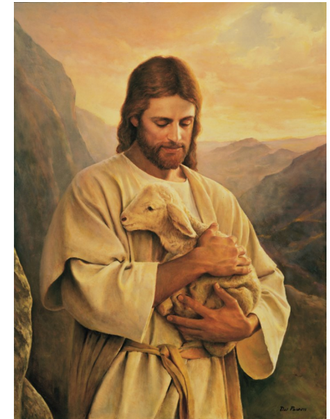
나는 내 양들에게 영원한 생명을 준다. <요한 10,27-30>

성 가 입당:137 봉헌:2,210,220 성체:178,151,166 파견:134 제 1 독서 사도행전 13,14. 43-52 <이제 우리는 다른 민족들에게 돌아섭니다.> 화 답 송 ◎ 우리는 주님의 백성, 그분 목장의 양 떼라네. 제 2 독서 요한 묵시록 7,9. 14-17 <어린양이 그들을 돌보시고 생명의 샘으로 그들을 이끌어 주실 것이다.> 복음환호송 ◎ 알렐루야. ◎ 주님이 말씀하신다. 나는 착한 목자다. 나는 내 양들을 알고 내 양들은 나를 안다. ◎ 알렐루야. 복 음 요한 10,27-30 <나는 내 양들에게 영원한 생명을 준다.> 영 성 체 송 착한 목자, 당신 양들을 위하여 목숨을 바치셨네. 당신 양 떼를 위하여 돌아가시고 부활하셨네. 알렐루야.