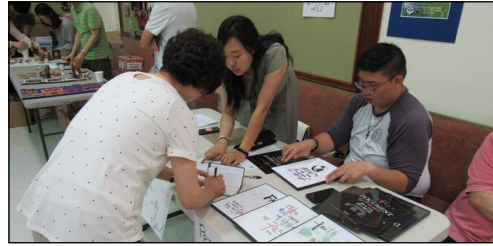
<청년 성령안의 삶 세미나> ↑ 5월 24일부터 27일까지 칼멜 피정의 집에서 청년 성령 세미나가 있습니다. 주일 친교실에서 접수중입니다.