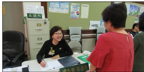
<예수회 후원금 모금> ↑ 매주 주일 친교실에서 예수회 후원금을 모금합니다. 교우분들의 많은 참여 부탁드립니다.