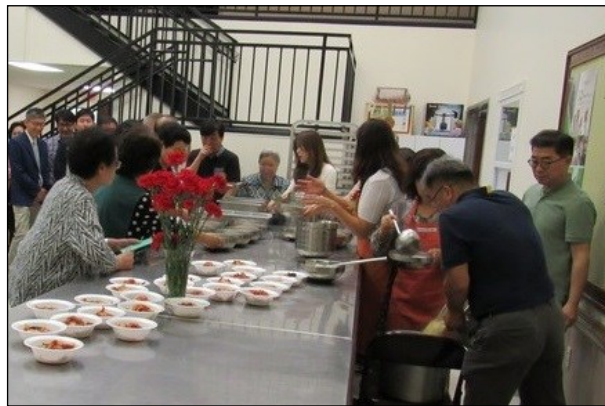
<사목회 점심 봉사> ↑ 5월 12일(일) 점심 봉사는 사목회에서 봉사하셨습니다.