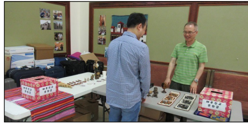
<페루 선교 후원금 및 물품 모집> ↑ 5월 24일부터 6월 5일까지 페루 선교를 떠납니다. 선교에 필요한 후원금과 물품을 모집하오니 교우분들의 많은 도움을 부탁드립니다.