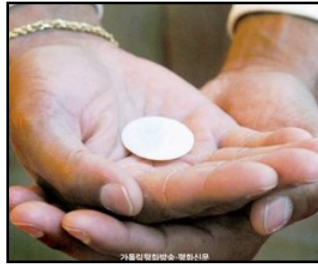
↑ 유아에게 세례를 주는 것은 교회의 오랜 전통이다. 우리나라에서는 세례 받은 아이가 분별력을 가진다고 여겨지는 10세 전후에 첫영성체를 하도록 하고 있다.