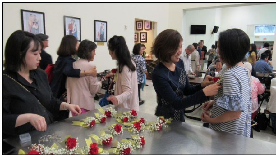
<Mother's Day 행사> ↑ 5월 12일(일) Mother's Day를 맞아 청년부에서 교우분들에게 카네이션을 달아드리는 행사를 마련했습니다.