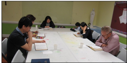
<새 영세자 성서 읽기 모임> ↑ 5월 12일(일) 오후 12시 30분부터 새 영세자 성서 읽기 모임이 112호에서 있었습니다.