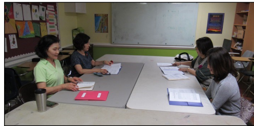
<7주간 성경 말씀 묵상 모임> ↑ 5월 12일(일)부터 7주 동안 성경 말씀 묵상 모임이 110호에서 있습니다.