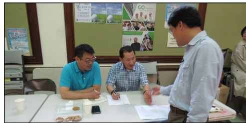
<울뜨레야 친선 골프대회> ↑ 5월 19일(일) 오후 12시부터 Heritage Golf Club에서 골프대회가 있습니다.