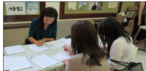
<주일 학교 여름캠프> ↑ 8월 1일부터 8월 4일까지 Westminster Camp에서 여름 캠프가 있습니다.