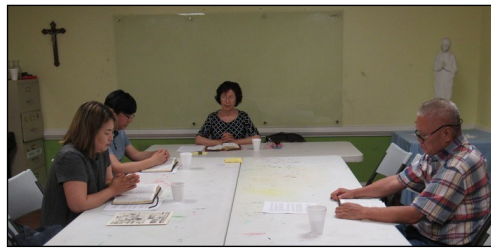
<새 영세자 성서 읽기 모임> ↑ 5월 19일(일) 오후 12시 30분부터 새 영세자성서 읽기 모임이 112호에서 있었습니다.