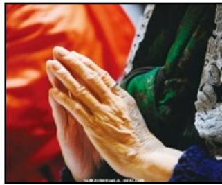
↑ 신령성체는 지극한 성체 신심의 또 다른 표현으로서 성체를 모시지 않고 마음으로 성체를 모셔도 같은 효과가 있다는 믿음이다.