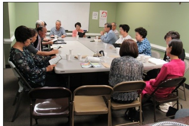
<Marietta 자비반 모임> ↑ 5월 19일(일) 오후 12시 30분에 대건도서관에서 모임이 있었습니다.