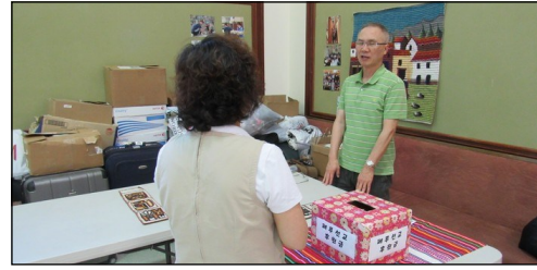
<페루 선교 후원금 및 물품 모집> ↑ 5월 23일부터 6월 4일까지 페루 비아엘 살바도르로 선교를 떠납니다. 선교에 필요한 후원금과 물품을 모집하오니 교구분들의 많은 도움을 부탁드립니다.