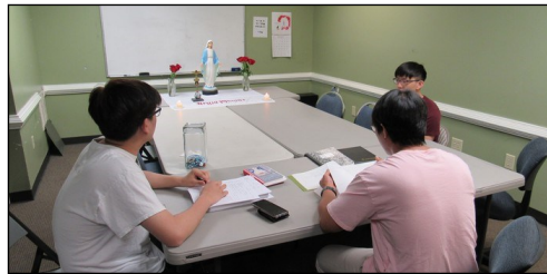
<소년 소녀 뿌리시디움 모임> ↑ 매주 일요일 오전 9시 30분부터 본당 소년 소녀로 구성된 '셋별' 뿌리시디움 모임이 대건도서관에서 있습니다.