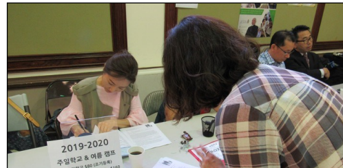
<주일 학교 조기 등록> ↑ 친교실에서 주일 학교 다음학기의 조기 등록을 받고 있습니다.