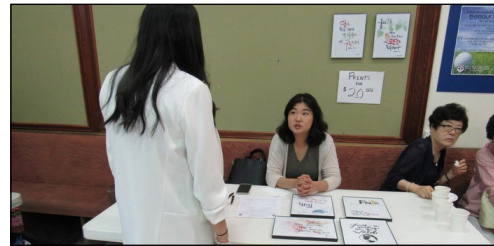
<청년 성령 세미나> ↑ 5월 25일부터 28일까지 Carmel Retreat Center에서 성령 세미나가 있습니다. 주일 친교실에서 접수 중입니다.