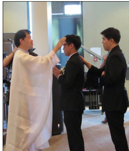
<주일학교 중고등부 세례/건진성사> ↑ 5월 19일(일) 오후 12시 15분 미사 중에 중.고등부 세례 및 건진 성사 예식이 있었습니다.