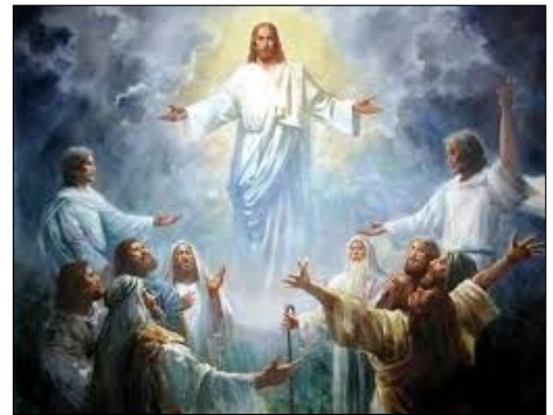
예수님께서는 그들에게 강복하시며 하늘로 올라가셨다.