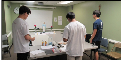
<소년 소녀 뿌리시디움 모임> ↑ 매주 일요일 오전 9시 30분부터 본당 소년 소녀로 구성된 '셋별' 뿌리시디움 모임이 대건도서관에서 있습니다.