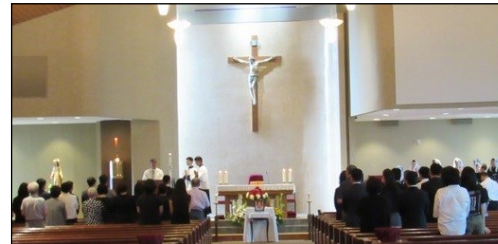
<추모 미사> ↑ 6월 20일(목) 오전 11시 30분부터故 장재준(안드레아)님의 추모 미사가 대성전에서 있었습니다.