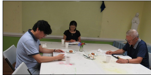
<새 영세자 성서 읽기 모임> ↑ 6월 23일(일) 오후 12시 30분부터 새 영세자 성서 읽기 모임이 112호에서 있었습니다.