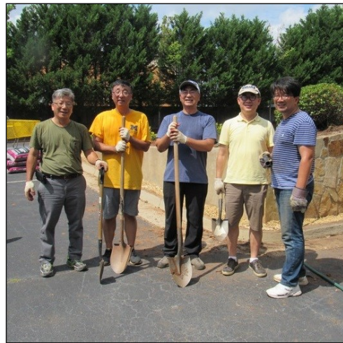
<본당 화단 미화 작업> → 6월 29일(토) 오전 9시부터 오후 12시까지 본당 신부님과 사목위원들이 함께 성당 입구 화단 미화 작업을 하셨습니다.