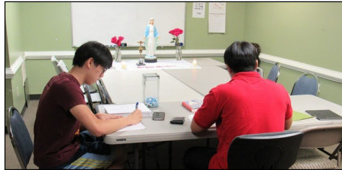
<소년 소녀 뿌리시디움 모임> ↑ 매주 일요일 오전 9시 30분부터 본당 소년 소녀로 구성된 '셋별' 뿌리시디움 모임이 대건도서관에서 있습니다.