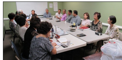
<Marietta-자비반 모임> ↑ 6월 30일(일) 오후 12시 30분부터 대건 도서관에서 모임이 있었습니다.