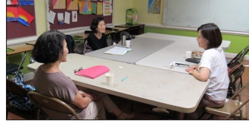
<7주간 성경 말씀 묵상 모임> ↑ 6월 30일(일) 오후 12시 30분부터 7주 동안 성경 말씀 묵상 모임이 110호에서 있습니다.