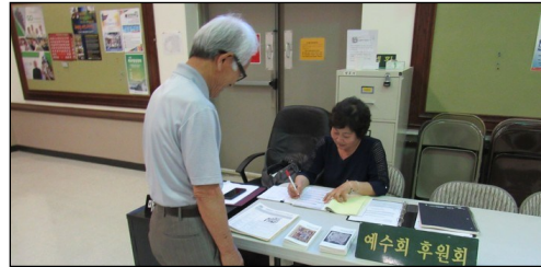
<예수회 후원금 모금> ↑ 매주 주일 친교실에서 예수회 후원금을 모금합니다. 교우분들의 많은 참여 부탁드립니다.