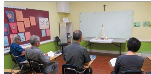
<다락방 기도회 모임> ↑ 매주 일요일 오전 9시 114호에서 다락방 기도 모임을 갖고 있습니다. 관심있는 교우들의 많은 참여 부탁드립니다.