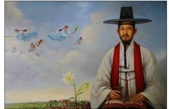
너희는 나 때문에 총독들과 임금들 앞에 끌려 가 그들과 다른 민족들에게 증언할 것이다. <마태오 10,17-22>

성 가 입당: 287 봉헌: 512/210 성체: 158/166 파견: 31 제 1 독 서 역대기 하권 24,18-22 <너희는 성소와 제단 사이에서 즈카르야를 살해하였다.> 화 답 송 ◎ 주님, 제 목숨 당신 손에 맡기나이다. 제 2 독 서 로마서 5,1-5 <우리는 환난도 자랑으로 여깁니다.> 복음환호송 ◎ 알렐루야. ○ 행복하여라, 의로움 때문에 박해를 받는 사람들! 하늘 나라가 그들의 것이다. ◎ 알렐루야. 복 음 마태오 10,17-22 <너희는 나 때문에 총독들과 임금들 앞에 끌려 가 그들과 다른 민족들에게 증언할 것이다.> 영 성 체 송 주님이 말씀하십니다. 누구든지 내 뒤를 따라오려면, 자신을 버리고 제 십자가를 지고 나를 따라야 한다.