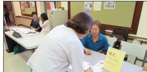
<M.E 주말 모집> ↑ 8월 2일(금)부터 8월 4일(토)까지 Carmel Retreat Center에서 피정이 있습니다. 주일 친교실에서 접수 중입니다.