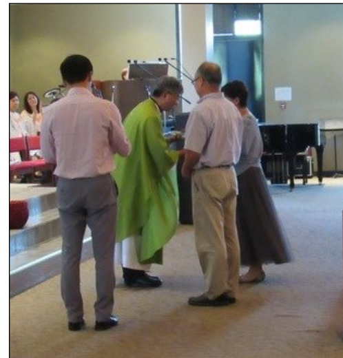
<구역장 감사패/임명장 수여> ↑ 6월 30일(일) 오전 10시 30분 미사 후에 신임 구역장 임명장 수여와 이임 구역장 감사패 전달 행사가 있었습니다.