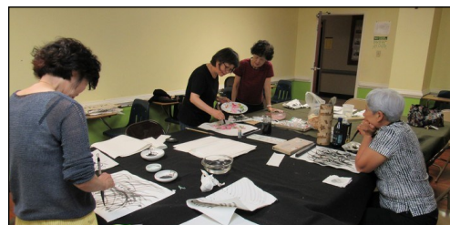
<동양화반 > ↑ 8월 3일(토) 오후 2시 30분부터 110호에서 동양화반 수업이 있었습니다.