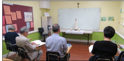
<다락방 기도회 모임> ↑ 매주 일요일 오전 9시 114호에서 다락방 기도 회 모임을 갖고 있습니다. 관심있는 교우들의 많은 참여 부탁드립니다.