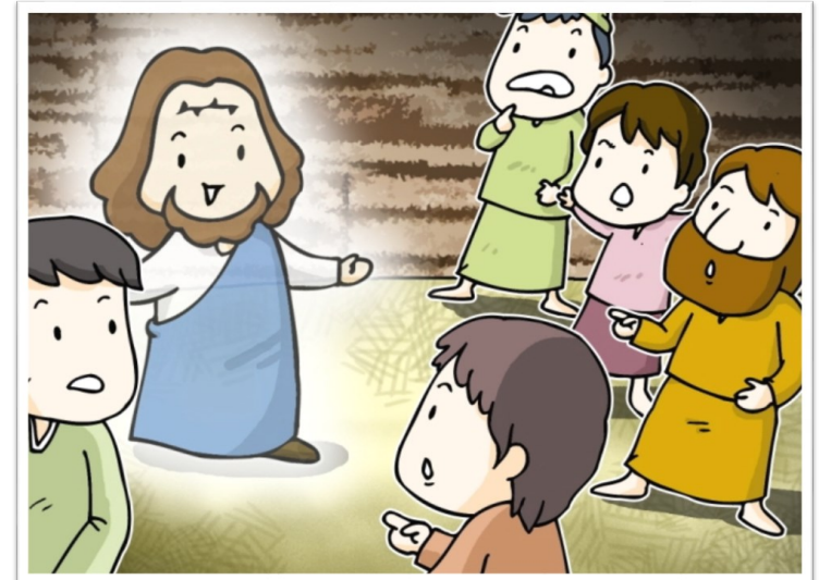
너희도 준비하고 있어라. <루카 12, 32-48>

성 가 입당: 4 봉헌: 211/215 성체: 151/172 파견: 6 제 1 독서 지혜서 18, 6-9 <주님께서는 저희의 적들을 처벌하신 그 방법으로 저희를 당신께 부르시고 영광스럽게 해주셨습니다.> 화 답 송 ◎행복하여라, 주님이 당신 소유로 뽑으신 백성! 제 2 독서 히브리서 11,1-2.8-19 <아브라함은 하느님께서 설계하시고 건축하신 도성을 기다리고 있었습니다.> 복음환호송 ◎알렐루야. ◎ 깨어 준비하고 있어라. 생각하지도 않은 때에 사람의 아들이 오리라. ◎알렐루야. 복 음 루카 12, 32-48 <너희도 준비하고 있어라.> 영 성 체 송 예루살렘아, 주님을 찬미하여라. 주님은 기쁨진 밀로 너를 배불리신다.