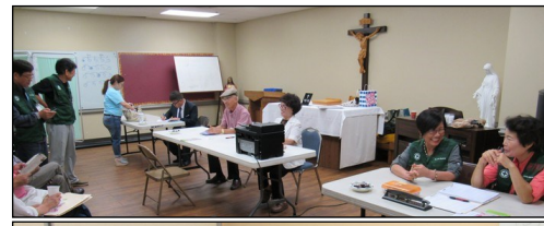
<성 루가 의료봉사회 진료> ↑ 8월 4일(일) 오후 12시 30분에 소성당에서 8월도 정기 진료가 있었습니다. 진료를 원하시는 분들은 복용하고 계신 약병을 지참해 주시면 진료시 도움됩니다.