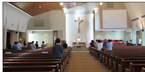
<성모 신심 미사> ↑ 8월 3일(토) 오후 12시에 대성전에서 성모 신심 미사가 봉헌되었습니다.