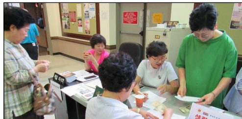
<미 동남부 성령 대회> ↑ 9월 1일(일)과 2일(월) 본당에서 성령 대회가 개최됩니다. 참가를 원하시는 교우분들은 주일 친교실에서 접수 바랍니다.