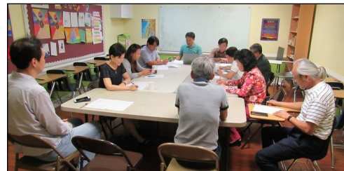
<구역장 월례 모임> ↑ 8월 4일(일) 오후 12시 20분부터 110호실에서 구역장 월례 모임이 있었습니다.