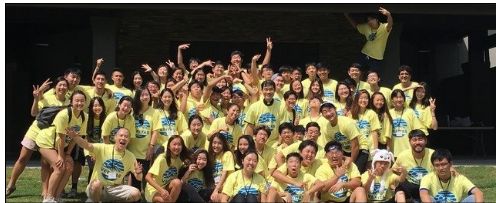
<2019 Youth Summer Camp> ↑ 8월 1일(목)부터 8월 4일(일)까지 Camp Westminster에서 한국순교자 성당과 성김대건 성당 학생 약 40여명이 참가한 가운데 Summer Camp가 있었습니다.