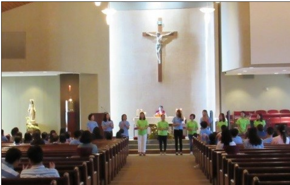
<대건 한국학교 개학> ↑ 8월 10일(토) 오전 9시 30분에 한국학교 개학을 맞이하여 대성전에서 개학 미사가 있었습니다.