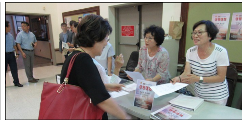
<미 동남부 성령 대회> ↑ 9월 1일(일)과 2일(월) 본당에서 성령 대회가 개최됩니다. 참가를 원하시는 교우분들은 주일 친교실에서 접수 바랍니다.