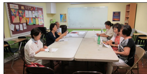
<성서 그룹공부 봉사자 모임> ↑ 8월 11일(일) 오후 12시 30분부터 110호에서 월례모임이 있었습니다.