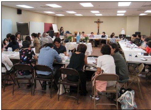
<구리아 월례 회의> ↑ 8월 11일(일) 오후 12시 30분부터 소성당에서 8월 월례 회의가 있었습니다. "평화의 모후" 뿌리시디움의 발표가 있었고 안건토의, 전달사항등으로 일정이 진행되었습니다.