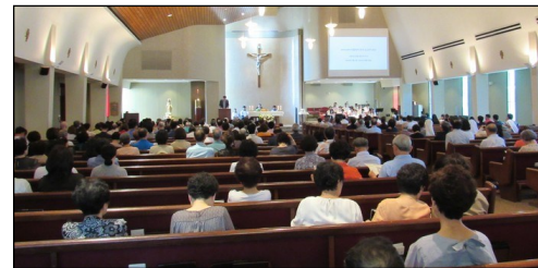
<본당 결산 보고> ↑ 2018-2019년 회계년도의 결산 보고가 8월 11일(일) 오전 10시 30분 미사 후에 있었습니다.