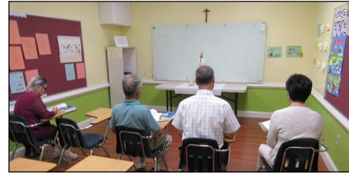
<다락방 기도회 모임> ↑ 매주 일요일 오전 9시 114호에서 다락방 기도 모임을 갖고 있습니다. 관심있는 교우들의 많은 참여 부탁드립니다.