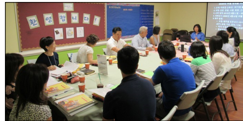
<2020년 부활 영세자 교리반> ↑ 8월 11일(일) 오전 9시에 2020년 부활 영세자 성인 교리반 첫 수업이 110호에서 진행되었습니다.