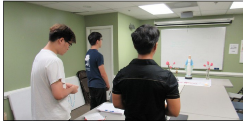
<소년 소녀 뿌리시디움 모임> ↑ 매주 일요일 오전 9시 30분부터 본당 소년 소녀로 구성된 '셋별' 뿌리시디움 모임이 대건도서관에서 있습니다.