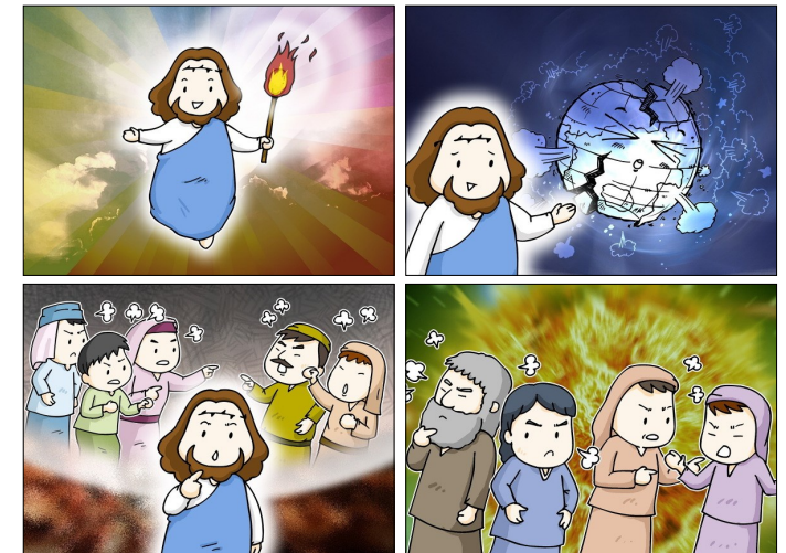
나는 평화를 주러 온 것이 아니라 분열을 일으키러 왔다. <루카 12, 49-53>

성 가 입당: 15 봉헌: 221/220 성체: 499/173 파견: 44 제 1 독서 예레미아서 38, 4-6. 8-10 <어찌자고 날 낳으셨나요? 온 세상을 상대로 말다툼을 벌이고 있는 이 사람을(예레 15,10).> 화 답 송 ◎ 주님, 어서 저를 도우소서. 제 2 독서 히브리서 12,1-4 <우리가 달려야 할 길을 꾸준히 달려갑시다.> 복음환호송 ◎ 알렐루야. ○ 주님이 말씀하신다. 내 양들은 내 목소리를 알아듣는다. 나는 그들을 알고 그들은 나를 따른다. ◎ 알렐루야. 복 음 루카 12, 49-53 <나는 평화를 주러 온 것이 아니라 분열을 일으키러 왔다.> 영 성 체 송 주님께는 자애가 있고 풍요로운 구원이 있네.