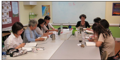
<한국 천주교회사 공부반> ↑ 매주 수요일 오전 10시 30분부터 110호에서 한국 천주교회사 수업이 진행되고 있습니다.