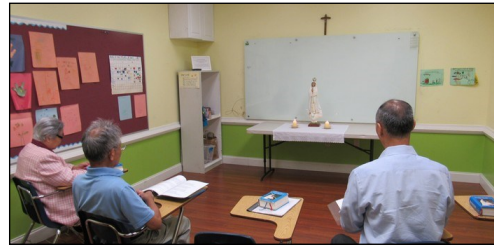
<다락방 기도회 모임> ↑ 매주 일요일 오전 9시 114호에서 다락방 기도 회 모임을 갖고 있습니다. 관심있는 교우들의 많은 참여 부탁드립니다.