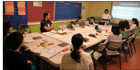
<2020년 부활 영세사 교리반> ↑ 매주 일요일 오전 9시부터 112호에서 2020년 부활 영세사 교리반 수업이 진행되고 있습니다.