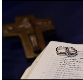
↑ 부부는 혼인성사로써 그 신분에 따른 의무와 품위에 걸맞게 견고해지도록 축성되고, 하느님의 사랑 안으로 받아들여진다.