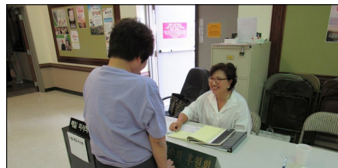
<예수회 후원금 모금> ↑ 매주 주일 친교실에서 예수회 후원금을 모금합니다. 교우분들의 많은 참여 부탁드립니다.