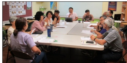
<구역장 월례 모임> ↑ 9월 1일(일) 오후 12시 20분부터 110호실에서 구역장 월례 모임이 있었습니다.