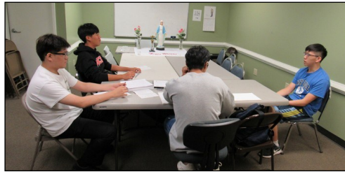
<소년 소녀 뿌리시디움 모임> ↑ 매주 일요일 오전 9시 30분부터 본당 소년 소녀로 구성된 '셋별' 뿌리시디움 모임이 대건도서관에서 있습니다.