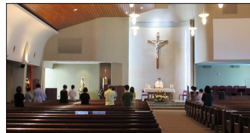
<성모신심 미사> ↑ 9월 7일(토) 오후 12시 미사는 성모신심 미사로 봉헌되었습니다.