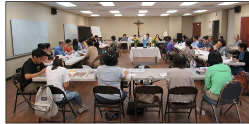
<꾸리아 월례 회의> ↑ 9월 8일(일) 오후 12시 30분부터 소성당에서 9월 월례 회의가 있었습니다. "사도들의 모후"와 "증거자들의 모후" 뿌리시디움의 발표가 있었고 안건토의, 전달사항등으로 일정이 진행되었습니다.