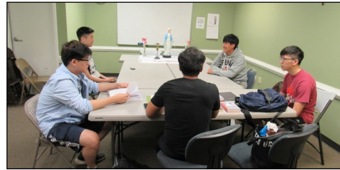
<소년 소녀 뿌리시디움 모임> ↑ 매주 일요일 오전 9시 30분부터 본당 소년 소녀로 구성된 '셋발' 뿌리시디움 모임이 대건도서관에서 있습니다.