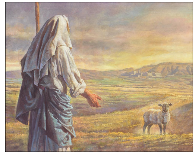
하늘에서는 회개하는 죄인 한 사람 때문에 더 기뻐할 것이다. <루카 15,1-32 >