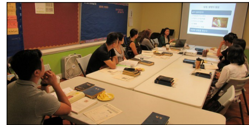
<2020년 부활 영세자 교리반> ↑ 매주 일요일 오전 9시부터 112호에서 2020년 부활 영세자 교리반 수업이 진행되고 있습니다.