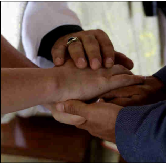
↑ 혼인 성사의 주인공은 자유로이 혼인 계약을 맺고 합의를 표명하는 신랑 신부다. [CNS 자료 사진]

혼인 성사의 주인공은 혼인 계약을 맺을 자유를 가지고 자신들의 혼인 합의를 표명하는 신랑 신부입니다. 신랑 신부에게 자유가 있다는 것은 그들이 강요당하지 않으며, 그들의 혼인이 자연법이나 교회법에 어긋나지 않는다는 뜻입니다. (「가톨릭교회 교리서」 1625항) 이 합의는 계약 당사자인 신랑 신부가 자신을 서로 주고받는 의지 행위입니다. 그러기에 폭력이나 공포 등 외부 요인에 속박받아서는 안 됩니다.