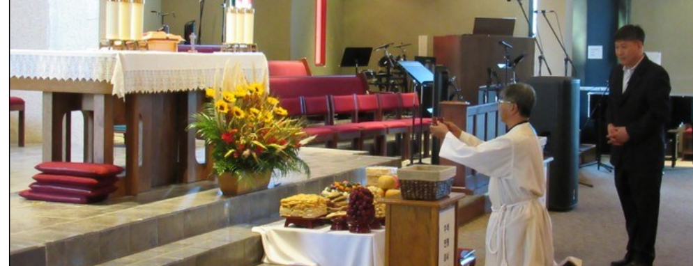
<한가위 미사> ↑ 9월 7일(토) 특전미사와, 8일(일) 오전 미사는 한가위 합동연령미사로 봉헌되었습니다. 미사 전에는 추석 상차림 예절이 있었습니다. 미사 후에는 성모회에서 정성스럽게 만든 점심을 교우분들께 제공하였습니다.