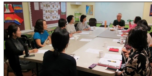
<성서 그룹공부 봉사자 모임> ↑ 9월 8일(일) 오후 12시 30분부터 110호에서 월례 모임이 있었습니다.