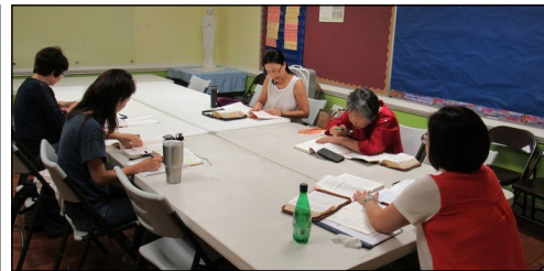
<사도행전 그룹성서 공부반> ↑ 매주 수요일 오전 10시 30분부터 112호에서 사도행전 성서공부가 있습니다.