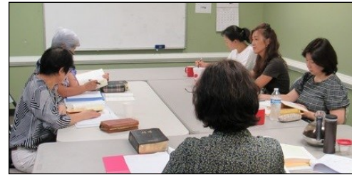
<창세기 그룹성서 공부반> ↑ 매주 수요일 오전 10시 30분부터 대건도서관에서 창세기 성서공부가 있습니다.