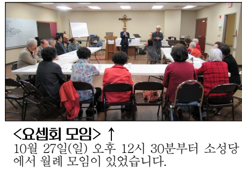
<구역 성서 봉사자 모임> ↑ 10월 27일(일) 오후 12시 30분부터 성가대실에서 모임이 있었습니다.