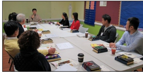
<2020년 부활 영세자 교리반> ↑ 매주 일요일 오전 9시부터 112호에서 2020년 부활 영세자 교리반 수업이 진행되고 있습니다.