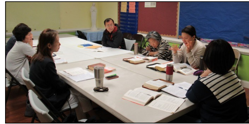
<사도행전 그룹성서 공부반> ↑ 매주 수요일 오전 10시 30분부터 112호에서 사도행전 성서공부가 있습니다.