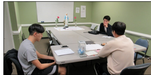
<소년 소녀 뿌리시디움 모임> ↑ 매주 일요일 오전 9시 30분부터 본당 소년 소녀로 구성된 '셋별' 뿌리시디움 모임이 대건도서관에서 있습니다.