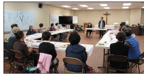
<안나 합창단 총회> ↑ 장례 미사에 성가대로 지속적으로 봉사해 오고 있는 안나 합창단 총회가 10월 25일(금) 오후 3시 30분부터 소성당에서 본당 신부님이 함께 참석하신 가운데 있었습니다. 매주 금요일 오후 1시 30분부터 3시까지 성가대실에서 합창 모임과 친교를 나누고 있으며 단원을 모집 중에 있습니다.