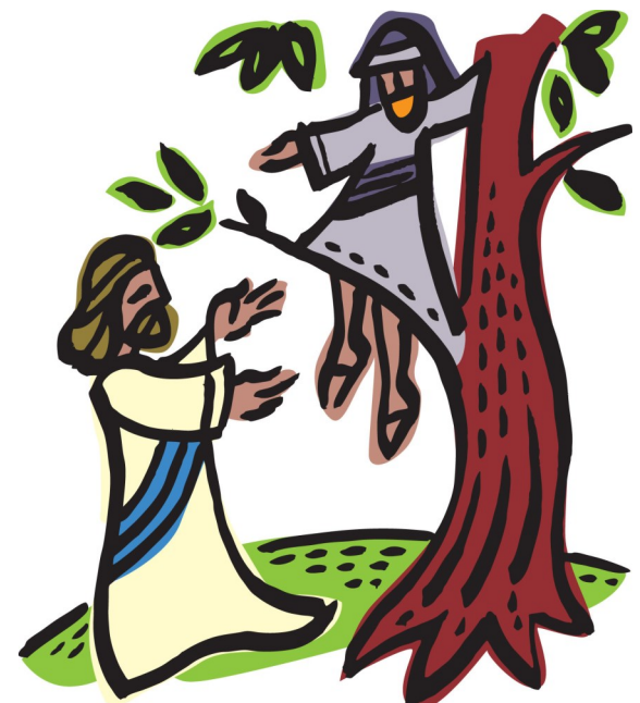
사람의 아들은 잃은 이들을 찾아 구원하러 왔다. <루카 19,1-10>

성 가 입당: 25 봉헌: 510 / 212 성체: 156 / 188 파견: 227 제 1 독서 지혜서 11,22-12,2 <주님께서는 존재하는 모든 것을 사랑하시므로 모든 사람에게 자비하십니다.> 화 답 송 ◎저의 임금이신 하느님, 영영 세세 당신 이름을 찬미하나이다. 제 2 독서 테살로니카 2서 1,11-2,2 <그리스도의 이름이 여러분 가운데에서 영광을 받고 여러분도 그분 안에서 영광을 받을 것입니다.> 복음환호송 ◎알렐루야. ○ 하느님은 세상을 너무나 사랑하신 나머지 외아들을 내주시어 그를 믿는 사람은 누구나 영원한 생명을 얻게 하셨네. ◎알렐루야. 복 음 루카 19,1-10 <사람의 아들은 잃은 이들을 찾아 구원하러 왔다.> 영 성 체 송 주님, 저에게 생명의 길 가르치시니, 당신 얼굴 뵈오며 기쁨에 넘치리이다.