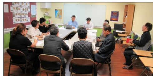
<구역장 월례모임> ↑ 11월 3일(일) 오후 12시 30분부터 110호실에서 월례모임이 있었습니다.