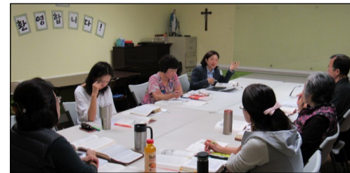
<사도행전 그룹성서 공부반> ↑ 매주 수요일 오전 10시 30분부터 112호에서 사도행전 성서공부가 있습니다.