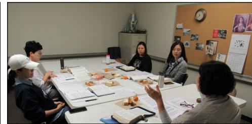
<요한 복음 그룹성서 공부반> ↑ 매주 수요일 오전 10시 30분부터 303호에서 요한 복음 성서공부가 있습니다.