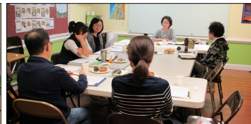
<마르코 복음 공부반> ↑ 매주 수요일 오전 10시 30분부터 110호에서 마르코복음 성서공부가 있습니다.