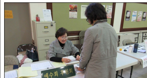
<예수회 후원금 모금> ↑ 매주 주일 친교실에서 예수회 후원금을 모금합니다. 교우분들의 많은 참여 부탁드립니다.