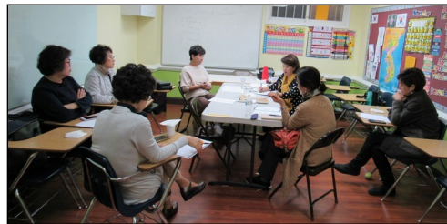
<사회복지분과 모임> ↑ 11월 3일(일) 오후 12시 30분부터 113호실에서 월례모임이 있었습니다.