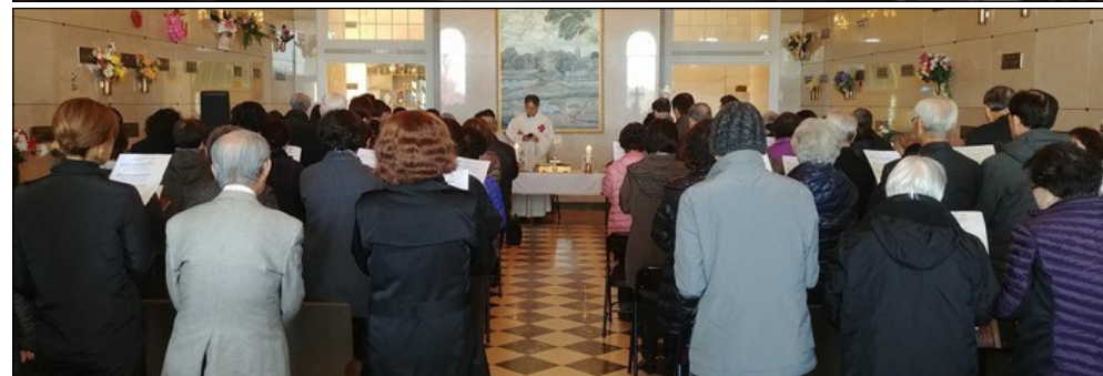
<야외 합동위령미사/본당 위령미사> ↑ 11월 2일(토) 오전 11시에 GA Memorial Park에서 야외 합동 위령 미사가 있었으며 본당 대성전에서는 오후 12시에 위령미사가 있었습니다.