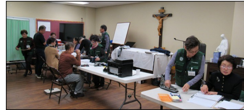
<성 루가 의료 봉사회 진료> ↑ 11월 3일(일) 오후 12시 30분에 소성당에서 11월도 정기진료가 있었습니다. 임상병리검사(피검사)를 11월 정기진료부터 3개월에 1회씩 실시합니다. 진료시 당뇨검사를 해드리오니 6시간 공복을 지켜 주시기 바랍니다.