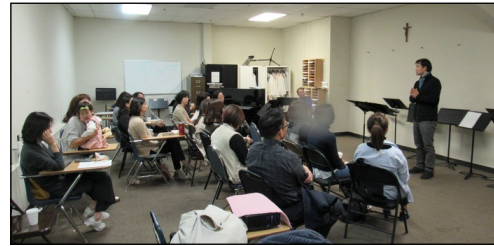
<Youth Group 학부모 모임> ↑ 11월 10일(일) 오전 10시 30분부터 성가대실에서 모임이 있었습니다.