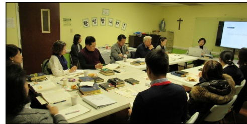
<2020년 부활 영세자 교리반> ↑ 매주 일요일 오후 12시 30분부터 112호에서 2019년 부활 영세자 교리반 수업이 계속되고 있습니다.