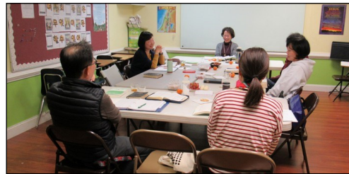
<마르코 복음 공부반> ↑ 매주 수요일 오전 10시 30분부터 110호에서 마르코복음 성서공부가 있습니다.