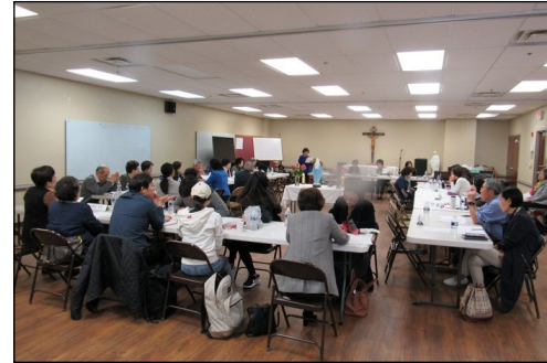
<꾸리아 월례 회의> ↑ 11월 10일(일) 오후 12시 30분부터 소성당에서 월례 회의가 있었습니다. "순교자들의 모후" 뿌리디시움의 사업보고 그리고 안건토의, 전달사항의 순으로 모임이 있었습니다.