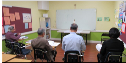
<다락방 기도회 모임> ↑ 매주 일요일 오전 9시 114호에서 다락방 기도 모임을 갖고 있습니다. 관심있는 교우들의 많은 참여 부탁드립니다.