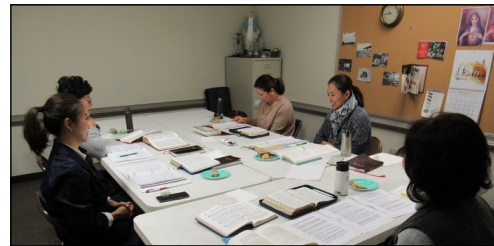
<요한 복음 그룹성서 공부반> ↑ 매주 수요일 오전 10시 30분부터 303호에서 요한 복음 성서공부가 있습니다.