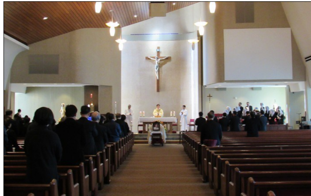
<장례 미사> ↑ 11월 9일(토) 오후 12시에故 김원순(울리안나)님의 장례미사가 본당 신부님 집전으로 대성전에서 봉헌되었습니다.