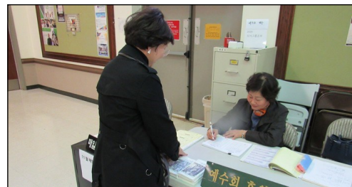
<예수회 후원금 모금> ↑ 매주 주일 친교실에서 예수회 후원금을 모금합니다. 교구분들의 많은 참여 부탁드립니다.