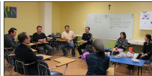
<빛과 소금 모임> ↑ 11월 17일(일) 오후 12시 30분부터 1층 유아실에서 월례 회의가 있었습니다.