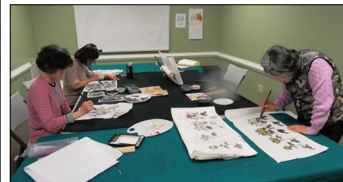
<동양화반> ↑ 매주 토요일 오후 2시 30분부터 대건도서관에서 수업이 진행되고 있습니다.