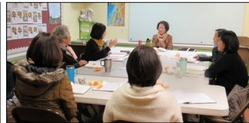
<한국 천주교회사 공부반> ↑ 매주 목요일 오전 10시 30분부터 110호에서 한국 천주교회사 수업이 진행되고 있습니다.