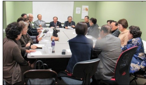
<Marietta 자비반 모임> ↑ 11월 17일(일) 오후 12시 30분부터 대건 도서관에서 월례 회의가 있었습니다.