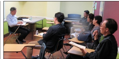
<전례분과 월례 회의> ↑ 11월 17일(일) 오후 12시 30분부터 108호실에서 월례 회의가 있었습니다.