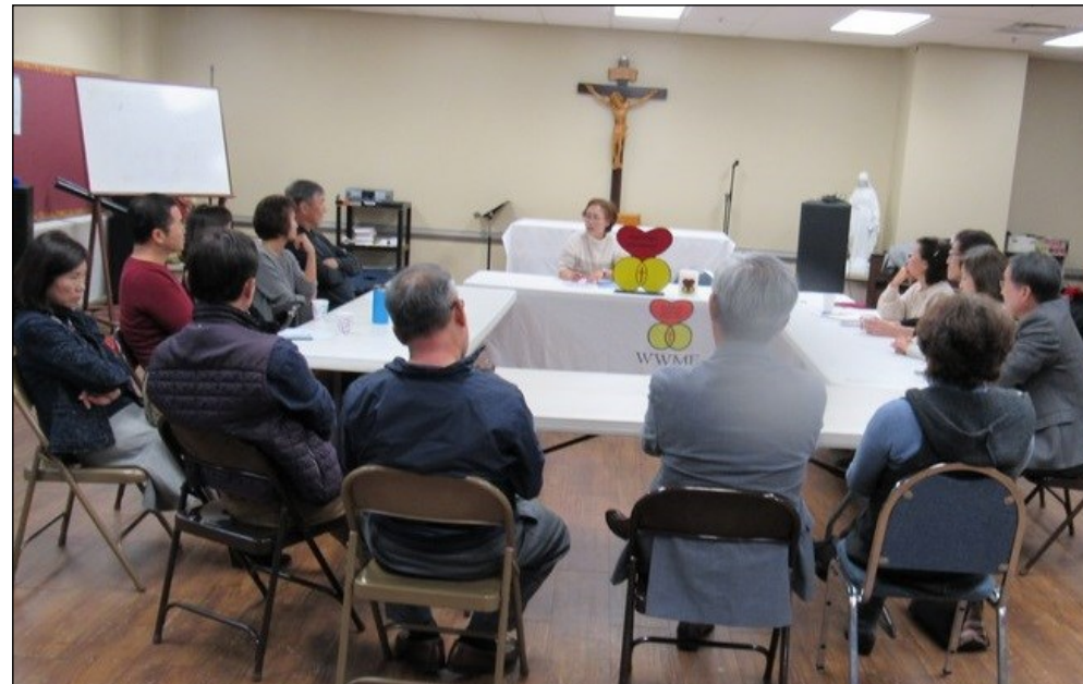
<ME 모임> ↑ 11월 17일(일) 오후 12시 30분부터 소성당에서 모임이 있었습니다.