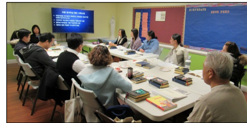
<2020년 부활 영세자 교리반> ↑ 매주 일요일 오전 9시부터 112호실에서 2020년 부활 영세자 교리반 수업이 계속되고 있습니다.