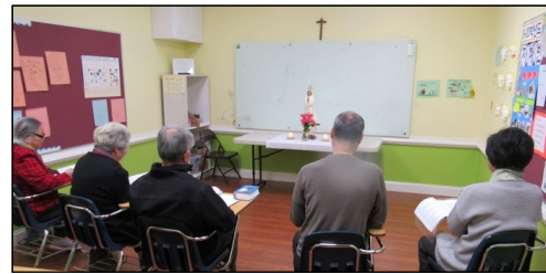
<다락방 기도회 모임> ↑ 매주 일요일 오전 9시 114호에서 다락방 기도 모임을 갖고 있습니다. 관심있는 교우들의 많은 참여 부탁드립니다.