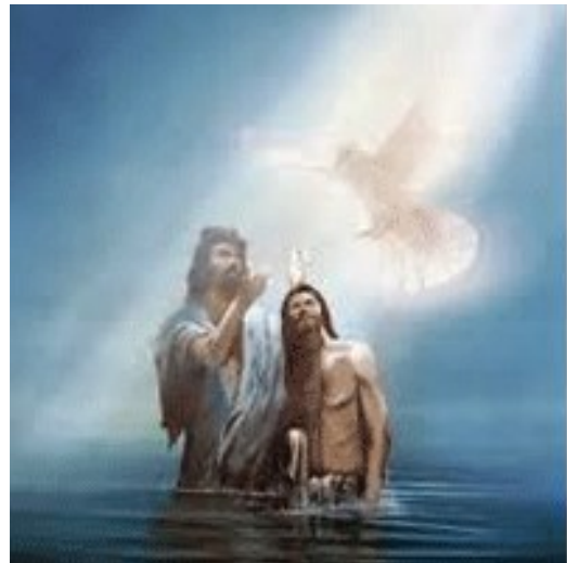
세례를 받으신 예수님께서서는 하느님의 영이 당신 위로 내려오시는 것을 보셨다. < 마태오 3,13-17 >