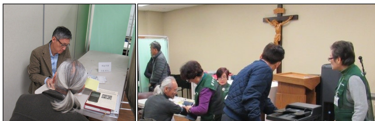
<성 루가 의료 봉사회 진료 안내 > ↑ 1월 5일(일) 오후 12시 30분에 소성당에서 1월도 정기 진료がありました. 진료를 원하시는 분들은 복용하고 계신 약병을 지참해 주시면 진료시 도움이 되오니 참조바랍니다.