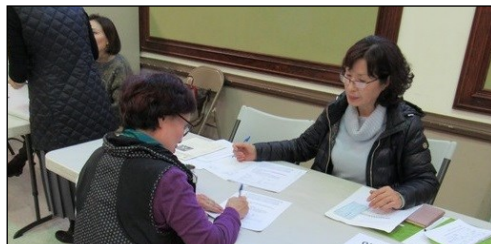
<이냐시오 영성 피정> ↑ 2월 11일부터 15일까지 Conyers 수도원에서 피정이 있습니다. 주일 친교실에서 접수 중입니다.