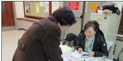
<예수회 후원금 모금> ↑ 매주 주일 친교실에서 예수회 후원금을 모금합니다. 교구분들의 많은 참여 부탁드립니다.