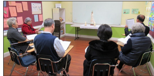
<다락방 기도회 모임> ↑ 매주 일요일 오전 9시 114호에서 다락방 기도 회 모임을 갖고 있습니다. 관심있는 교우들의 참여 부탁드립니다.