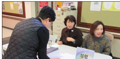
<미동남부 성령쇄신 봉사자 세미나> ↑ 1월 26일부터 29일까지 Ignatius Retreat Center에서 봉사자 피정이 있습니다. 주일 친교실에서 접수 중입니다.