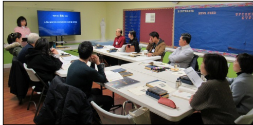
<2020년 부활 영세자 교리반 > ↑ 매주 일요일 오전 9시부터 112호에서 2020년 부활 영세자 교리반 수업이 계속되고 있습니다. 또한 2020년 부활절에 함께 있을 견진성사 교리가 2월 2일부터 4월 5일까지 8주 동안 112호실에서 잇사오니 사무실로 접수바랍니다.