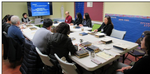
<2020년 부활 영세자 교리반 > ↑ 매주 일요일 오전 9시부터 112호에서 2020년 부활 영세자 교리반 수업이 계속되고 있습니다. 또한 2020년 부활절에 함께 있을 견진성사 교리가 2월 2일부터 4월 5일까지 8주 동안 112호실에서 있사오니 사무실로 접수바랍니다.