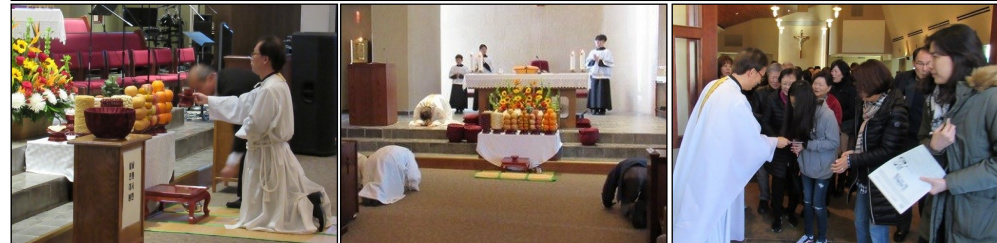
<설 합동 연령 미사 및 행사> ↑ 설날을 맞아 1월 19일(토) 특전미사와 1월 20일(일) 오전 8시 30분, 10시 30분 미사 전에는 돌아가신 조상님들을 기억하는 설날 상차림 예절이 있었습니다. 미사 후에는 본당 주임 신부님과 교우들께서는 서로 세배를 드리는 시간을 마련 하였습니다. 미사 후에는 친교실에서 성모회에서 마련한 떡국을 함께 드시며 친교를 나누셨습니다.