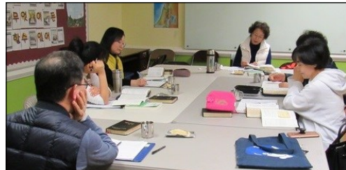
<마르코 그룹성서 공부반> ↑ 매주 수요일 오전 10시 30분부터 110호에서 마르코 성서공부가 있습니다.