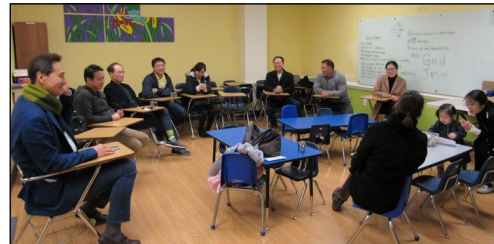
<빛과 소금 모임> ↑ 1월 19일(일) 오후 12시 30분부터 1층 유아 방에서 모임이 있었습니다.