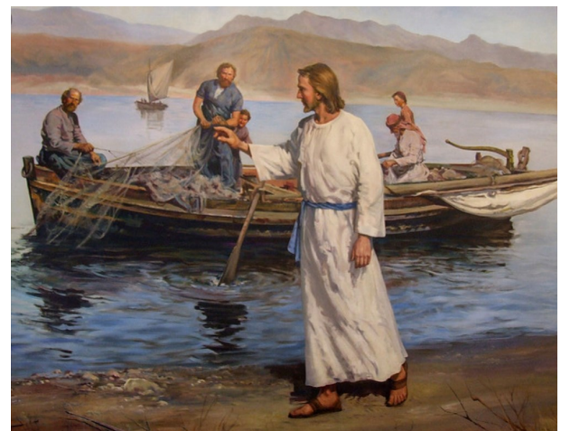
예수님께서서는 카파르나움으로 가셨다. 이사야를 통하여 하신 말씀이 이루어지려고 그리된 것이다. < 마태오 4,12-23 >