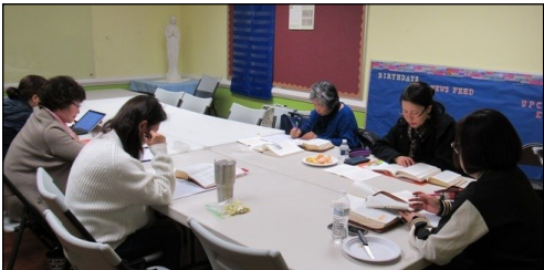
<사도행전 그룹성서 공부반> ↑ 매주 수요일 오전 10시 30분부터 112호에서 사도행전 성서공부가 있습니다.