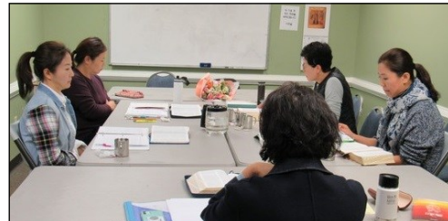
<요한 복음 그룹성서 공부반> ↑ 매주 수요일 오전 10시 30분부터 대건도서관에서 요한 복음 성서공부가 있습니다.