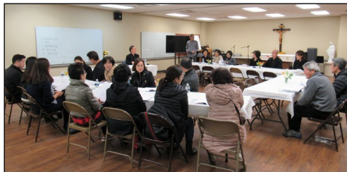
<해설 독서자 모임> ↑ 1월 18일(토) 오후 5시부터 소성당에서 본당 주임 신부님을 모시고 모임이 있었습니다.