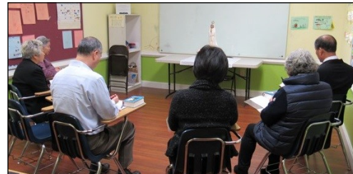
<다락방 기도회 모임> ↑ 매주 일요일 오전 9시 114호에서 다락방 기도 모임을 갖고 있습니다. 관심있는 교우들의 참여 부탁드립니다.