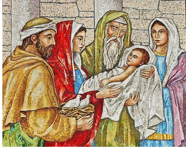
제 눈이 주님의 구원을 보았습니다. < 루카 2,22-40 >