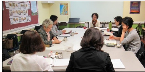
<한국 천주 교회사 공부반> ↑ 매주 목요일 오전 10시 30분부터 110호에서 공부가 있습니다.