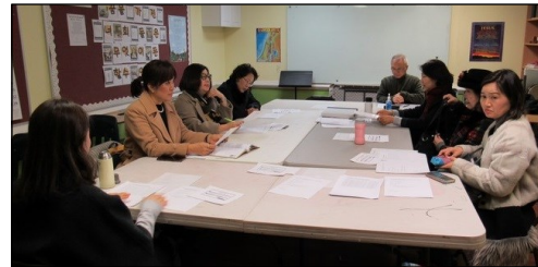
<성서 그룹공부 봉사자 모임> ↑ 2월 9일(일) 오후 12시 30분부터 115호에서 월례모임이 있었습니다.