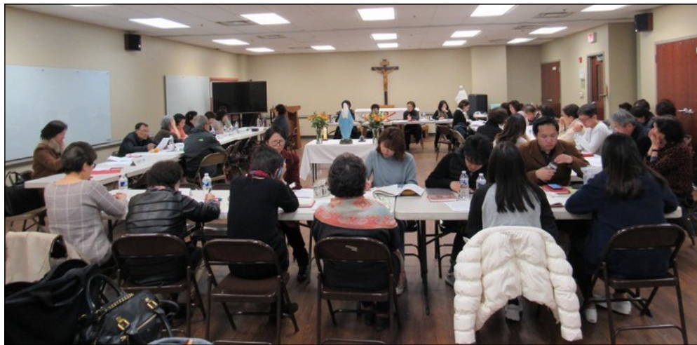
<꾸리아 월례 회의> ↑ 2월 9일(일) 오후 12시 30분부터 소성당에서 2월 월례 회의가 있었습니다. "상아탑" 뿌리시디움과 "만민의 어머니" 뿌리시디움의 발표가 있었고 안건토의, 전달사항등으로 일정이 진행되었습니다.