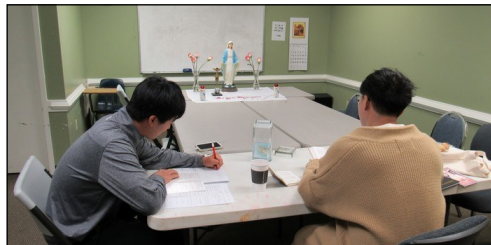
<소년 소녀 레지오 마리아> ↑ 매주 일요일 오전 9시 30분부터 본당 소년으로 구성된 '샬렐' 뿌리시디움 모임이 대건 도서관에서 있습니다.