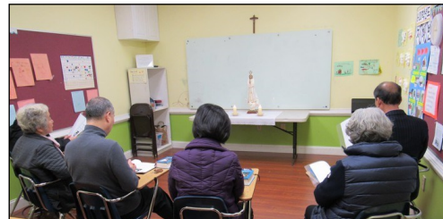
<다락방 기도회 모임> ↑ 매주 일요일 오전 9시 114호에서 다락방 기도 모임을 갖고 있습니다. 관심있는 교우들의 많은 참여 부탁드립니다.