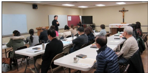
<2020년 부활 전진성사 교리반> ↑ 2020년 부활절에 함께 있을 전진성사 교리반 수업이 2월 2일부터 4월 5일까지 8주 동안 매주 일요일 소성당에서 있습니다.