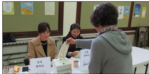
<성경 통독 계획표 회수> ↑ 매주 일요일 오전에 친교실에서 성경 통독 계획표를 회수합니다. 평일에는 사무실로 제출하시기 바랍니다.