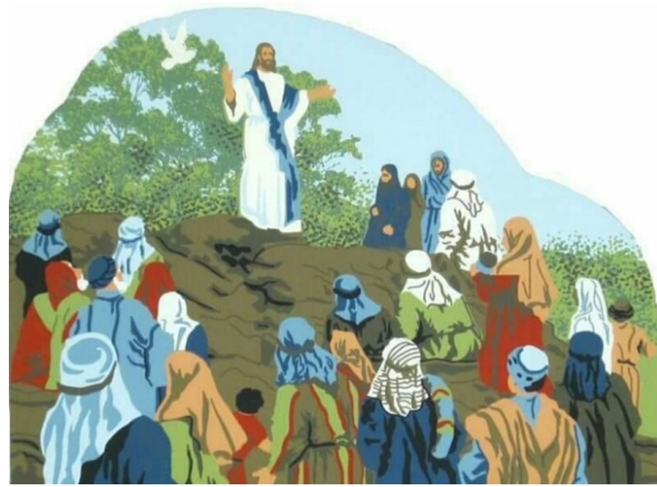
옛사람들에게 이르신 말씀과 달리, 나는 너희에게 말한다. < 마태오 5,17-37 >