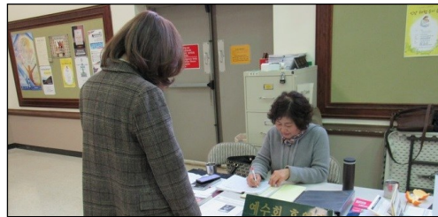
<예수회 후원금 모금> ↑ 매주 주일 친교실에서 예수회 후원금을 모금합니다. 교구분들의 많은 참여 부탁드립니다.