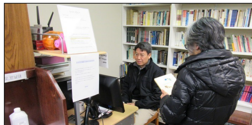
<성물방 도서 대여> ↑ 매주 일요일 오전 10시부터 오후 1시까지 성물방에서 도서를 대여해 드리오니 많은 이용바랍니다.