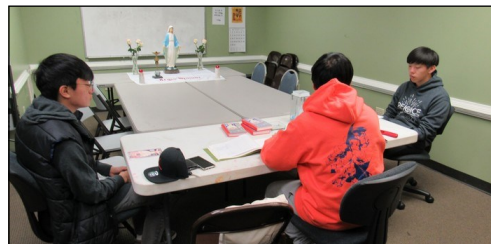
<소년 뿌리시디움 모임> ↑ 매주 일요일 오전 9시 30분부터 본당 소년 뿌리시디움 모임이 대건도서관에서 있습니다.