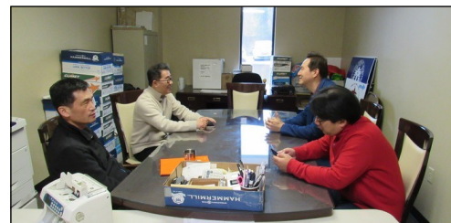
<사목회 회장단 회의> ↑ 3월 8일(일) 오후 12시부터 119호실에서 교우분들의 효과적인 코로나19 감염 예방에 관한 안건으로 회의가 있었습니다.