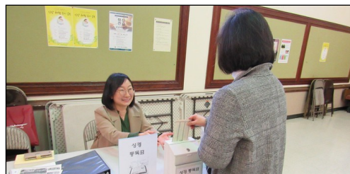
<성경 통독 계획표 회수> ↑ 매주 일요일 오전에 친교실에서 성경 통독 계획표를 회수합니다. 평일에는 사무실로 제출하시기 바랍니다.