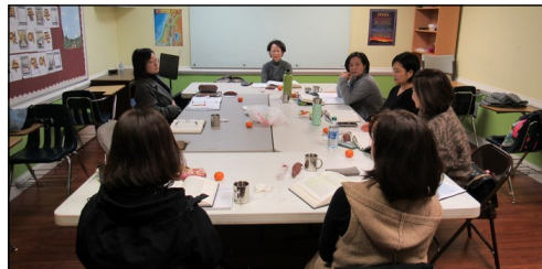
<한국 전주 교회사 공부반> ↑ 매주 목요일 오전 10시 30분부터 110호에서 공부가 있습니다.