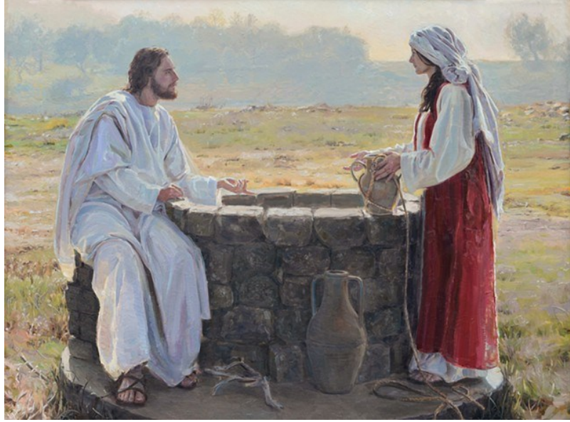
숫아오르는 영원한 생명의 샘물 < 요한 4,5-42 >

성 가 입당: 490 봉헌: 41/54 성체: 151/174 파견: 124 제 1 독서 탈출기 17,3-7 <우리가 마실 물을 내놓으시오(탈출 17,2).> 화 답 송 ◎ 오늘 주님 목소리에 귀를 기울여라. 너희 마음을 무디게 하지 마라. 제 2 독서 로마서 5,1-2.5-8 <우리가 받은 성령을 통하여 하느님의 사랑이 우리에게 부어졌습니다.> 복음환호송 ◎ 그리스도님, 찬미와 영광 받으소서. ○ 주님, 당신은 참으로 세상의 구원자이시니 저에게 영원히 목마르지 않을 생명의 물을 주소서. ◎ 그리스도님, 찬미와 영광 받으소서. 복 음 요한 4,5-42 <숫아오르는 영원한 생명의 샘물> 영성체 송 주님이 말씀하십니다. 내가 주는 물을 마시면, 네 안에서 영원한 생명의 샘이 솟아나리라.