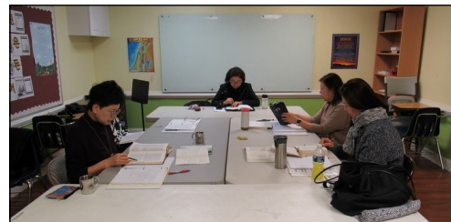
<요한 복음 그룹성서 공부반> ↑ 매주 수요일 오전 10시 30분부터 대건도서관에서 요한 복음 성서공부가 있습니다.