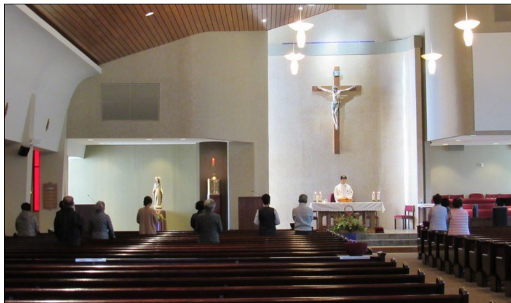
<성모 신심 미사> ↑ 3월 7일(토) 오후 12시에 대성전에서 성모 신심 미사가 봉헌되었습니다.