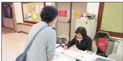
<예수회 후원금 모금> ↑ 매주 주일 친교실에서 예수회 후원금을 모금합니다. 교구분들의 많은 참여 부탁드립니다.