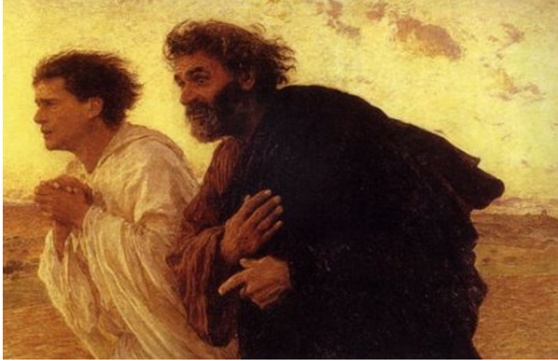
예수님께서서는 죽은 이들 가운데에서 다시 살아나셔야 한다. < 요한 20,1-9 >