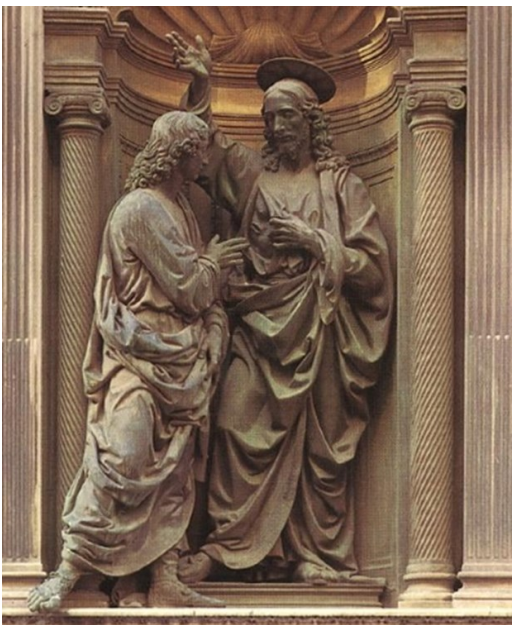
여드레 뒤에 예수님께서 오셨다. < 요한 20,19-31 >

성 가 입당: 128 봉헌: 220 성체: 169 파견: 129 제 1 독서 사도행전 2,42-47 <신자들은 모두 함께 지내며 모든 것을 공동으로 소유하였다.> 화 답 송 ◎ 주님은 좋으신 분, 찬송하여라. 주님의 자애는 영원하시다. 제 2 독서 베드로 1서 1,3-9 <하느님께서서는 우리를 새로 태어나게 하시어 죽은 이들 가운데에서 다시 살아나신 예수 그리스도의 부활로 우리에게 생생한 희망을 주셨습니다.> 복음환호송 ◎ 알렐루야. ○ 주님이 말씀하신다. 토마스야, 너는 나를 보고서야 믿느냐? 보지 않고도 믿는 사람은 행복하다. ◎ 알렐루야. 복 음 요한 20,19-31 <여드레 뒤에 예수님께서 오셨다.> 영 성 체 송 네 손을 넣어 못 자국을 확인해 보아라. 의심을 버리고 믿어라. 알렐루야.