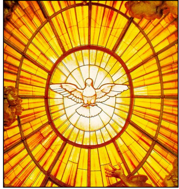
나는 길이요 진리요 생명이다. < 요한 14,15-21 >