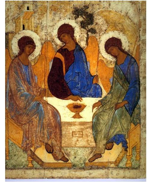
하느님께서 아들을 세상에 보내신 것은 세상이 아들을 통하여 구원을 받게 하시려는 것이다. < 요한 3,16-18 >