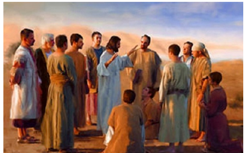
육신을 죽이는 자들을 두려워하지 마라. < 마태오 10,26-33 >