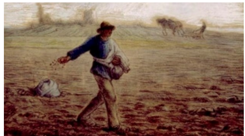
수확 때까지 둘 다 함께 자라도록 내버려 두어라. < 마태오 13,24-43 >