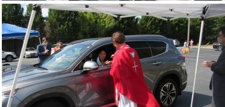
본당의 날 기념 선물 증정