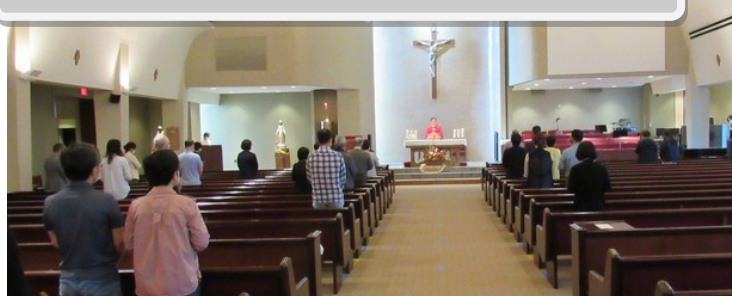
주일 오전 8시 30분 미사