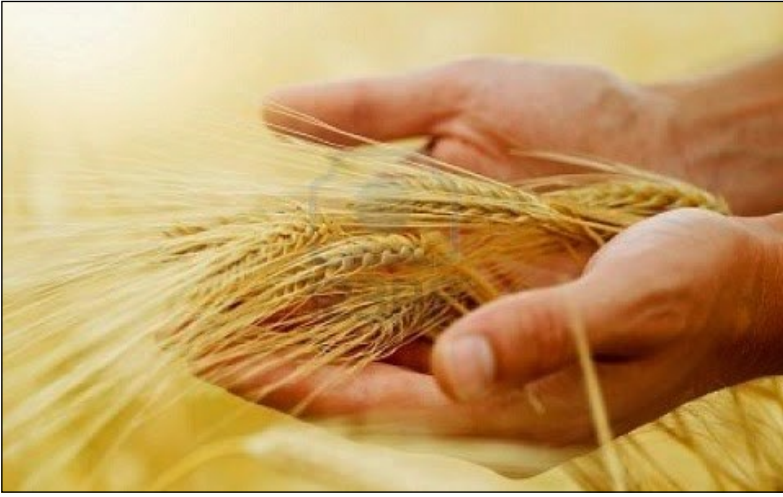
모든 탐욕을 경계하여라. 아무리 부유하더라도 사람의 생명은 그의 재산에 달려 있지 않다. < 루카 12,15-21 >

성 가 입당: 329 봉헌: 513 성체: 172/163 파견: 19 제 1 독서 요엘 예언서 2,22-24,26 <타작마당은 곡식으로 가득하리라.> 화 답송 ◎ 온갖 열매 땅에서 거두었으니, 하느님, 우리 하느님이 복을 내 셧네. 제 2 독서 요한 묵시록 14,13-16 <그들이 한 일이 그들을 따라가리라.> 복음환호송 ◎ 알렐루야. ○ 뿌릴 씨 들고 울며 가던 사람들, 곡식 단 안고 환호하며 돌아오 리라. ◎ 알렐루야. 복 음 루카 12,15-21 <모든 탐욕을 경계하여라. 아무리 부유하더라도 사람의 생명은 그의 재산에 달려 있지 않다.> 영 성 체 송 주님, 땅은 당신이 내신 열매로 가득하옵니다. 당신은 땅에서 양식 을 거두게 하시고, 인간의 마음 흥겹게 하는 술을 주시나이다.