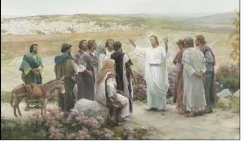
너희는 가서 모든 민족들을 제자로 삼아라. < 마태오 28,16-20 >

성 가 입당: 450 봉헌: 211 성체: 179/169 파견: 63 제 1 독서 이사야서 2,1-5 <모든 민족들이 주님의 산으로 밀려들리라.> 화 답 송 ◎ 주님은 민족들의 눈앞에 당신 정의를 드러내셨네. 제 2 독서 로마서 10,9-18 <선포하는 사람이 없으면 어떻게 들을 수 있겠습니까? 파견되지 않았으면 어떻게 선포할 수 있겠습니까?> 복음환호송 ◎ 알렐루야. ○ 주님이 말씀하십니다. 너희는 가서 모든 민족들을 가르쳐라. 내가 세상 끝 날까지 언제나 너희와 함께 있으리라. ◎ 알렐루야. 복 음 마태오 28,16-20 <너희는 가서 모든 민족들을 제자로 삼아라.> 영 성 체 송 주님이 말씀하십니다. 내가 너희에게 명령한 것을 모든 민족들에게 가르쳐 지키게 하여라. 내가 세상 끝 날까지 언제나 너희와 함께 있으리라.