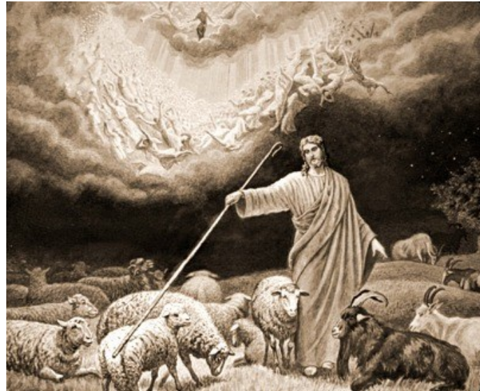
사람의 아들이 자기의 영광스러운 옥좌에 앉아 모든 민족들을 가를 것이다. < 마태오 25,31-46 >

성 가 입당: 78 봉헌: 340 성체: 499/498 파견: 73 제 1 독 서 에제키엘 예언서 34,11-12.15-17 <너희 나의 양 떼야. 나 이제 양과 양 사이의 시비를 가리겠다.> 화 답 송 ◎ 주님은 나의 목자, 아쉬울 것 없으라. 제 2 독 서 코린토 1서 15,20-26.28 <그리스도께서는 나라를 하느님 아버지께 넘겨 드리셨습니다. 하느님께서는 모든 것 안에서 모든 것이 되실 것입니다.> 복음환호송 ◎ 알렐루야. ○ 주님의 이름으로 오시는 분, 찬미받으소서! 다가오는 우리 조상 다윗의 나라는 복되어라! ◎ 알렐루야. 복 음 마태오 25,31-46 <사람의 아들이 자기의 영광스러운 옥좌에 앉아 모든 민족들을 가를 것이다.> 영 성 체 송 주님이 영원한 임금으로 앉으셨네. 주님이 당신 백성에게 강복하여 평화를 주시리라.