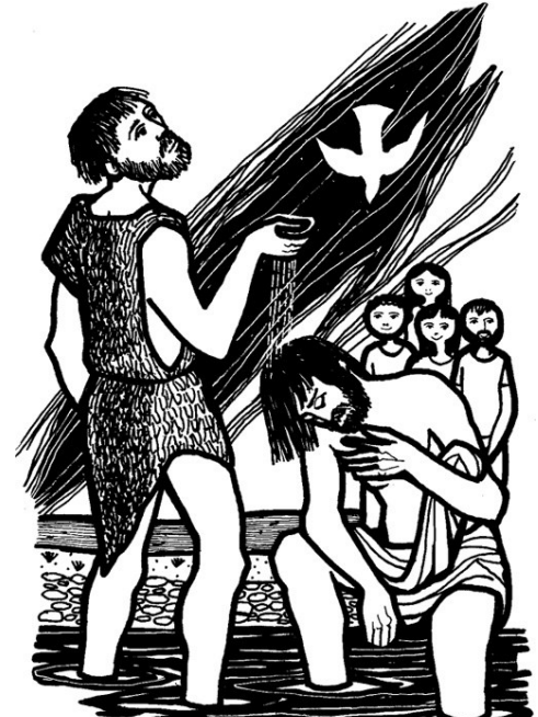
너희는 주님의 길을 곧게 내어라. < 마르코 1,1-8 >