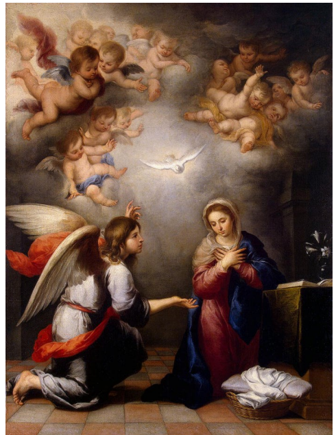
보라, 이제 네가 잉태하여 아들을 낳을 것이다. < 루카 1,26-38 >

성 가 입당: 97 봉헌: 215 성체: 167/181 파견: 91 제 1 독서 사무엘기 하권 7,1-5.8-12.14.16 <다윗의 나라는 주님 앞에서 영 원할 것이다.> 화답송 ◎ 주님, 당신 자애를 영원히 노래하오리다. 제 2 독서 로마서 16,25-27 <오랜 세월 감추어 두셨던 신비가 이제 알려지 게 되었습니다.> 복음환호송 ◎ 알렐루야. ○ 보소서, 저는 주님의 종입니다. 말씀하신 대로 저에게 이루어 지기를 바랍니다. ◎ 알렐루야. 복음 루카 1,26-38 <보라, 이제 네가 잉태하여 아들을 낳을 것이다.> 영성체송 보라, 동정녀가 잉태하여 아들을 낳으리니, 그 이름을 임마누엘이 라 하리라.