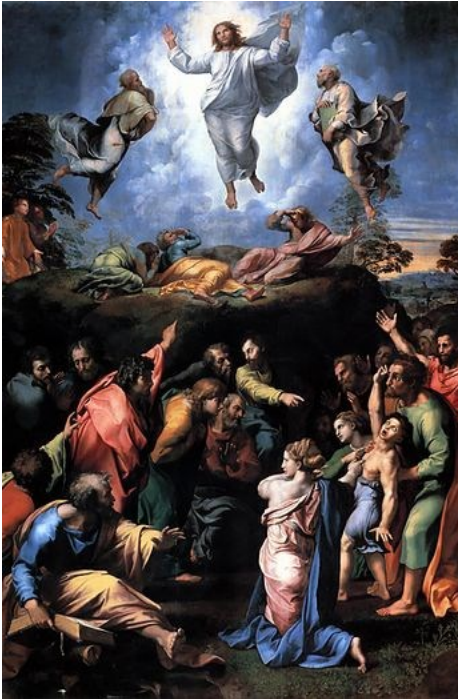
이는 내가 사랑하는 아들이다. < 마르코 9,2-10 >