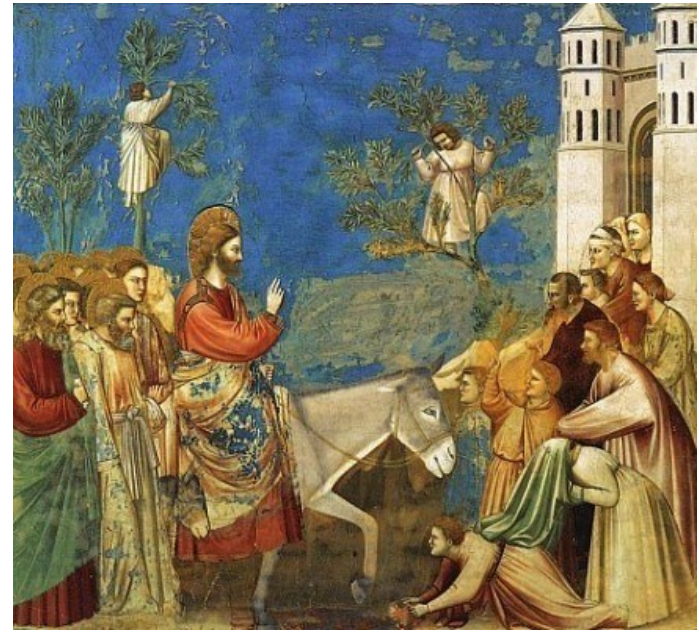
우리 주 예수 그리스도의 수난기 < 마르코 14,1-15,47 >

성가 입당: 119 봉헌: 216 성체: 169 / 172 파견: 123 제 1 독서 이사야서 50,4-7 <나는 모욕을 받지 않으려고 내 얼굴을 가리지도 않았다. 나는 부끄러운 일을 당하지 않을 것임을 안다(주님의 종'의 셋째 노래).> 화답송 ◎ 하느님, 저의 하느님, 어찌하여 저를 버리셨나이까? 필리피서 2,6-11 <그리스도께서는 당신 자신을 낮추셨습니다. 그러므로 하느님께서도 그분을 드높이 올리셨습니다.> 복음환호송 ◎ 그리스도님, 찬미와 영광 받으소서. ○ 그리스도는 우리를 위하여 죽음에 이르기까지, 십자가 죽음에 이르기까지 순종하셨네. 하느님은 그분을 드높이 올리시고 모든 이름 위에 뛰어난 이름을 주셨네. ◎ 그리스도님, 찬미와 영광 받으소서. 복음 마르코 14,1-15,47 <우리 주 예수 그리스도의 수난기> 영성체송 아버지, 이 잔을 비켜 갈 수 없어 제가 마셔야 한다면, 아버지의 뜻이 이루어지게 하소서.