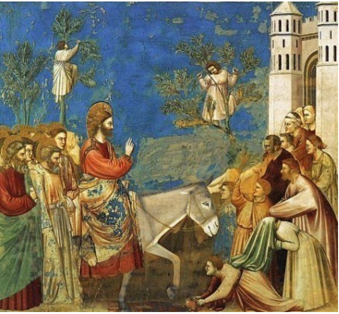
여드레 뒤에 예수님께서 오셨다. < 요한 20,19-31 >

성 가 입당: 132 봉헌: 221 성체: 176/499 파견: 134 제 1 독서 사도행전 4,32-35 <한마음 한뜻> 화 답 송 ◎ 주님은 좋으신 분, 찬송하여라. 주님의 자애는 영원하시다. 제 2 독서 요한 1서 5,1-6 <하느님에게서 태어난 사람은 모두 세상을 이깁니다.> 복음환호송 ◎ 알렐루야. ○ 주님이 말씀하신다. 토마스야, 너는 나를 보고서야 믿느냐? 보지 않고도 믿는 사람은 행복하다. ◎ 알렐루야. 복 음 요한 20,19-31 <여드레 뒤에 예수님께서 오셨다.> 영 성 체 송 네 손을 넣어 못 자국을 확인해 보아라. 의심을 버리고 믿어라. 알렐루야.