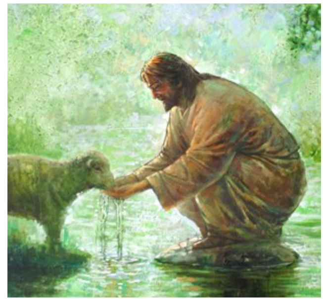
친구들을 위하여 목숨을 내놓는 것보다 더 큰 사랑은 없다. < 요한 15,9-17 >