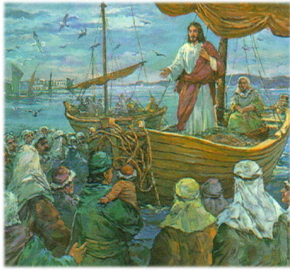
그들은 목자 없는 양들 같았다. < 마르코 6,30-34 >

성 가 입당: 51 봉헌: 216/217 성체: 170/180/172 파견: 68 제 1 독서 예레미야서 23,1-6 <나는 살아남은 양들이 다시 모아들여 그들은 돌보아 줄 목자들을 세워 주리라.> 화 답 송 ◎ 주님은 나의 목자, 아쉬울 것 없으라. 제 2 독서 에페소서 2,13-18 <유대인과 이민족을 하나로 만드신 그리스도는 우리의 평화이십니다.> 복음환호송 ◎ 알렐루야. ○ 주님이 말씀하신다. 내 양들은 내 목소리를 알아듣는다. 나는 그들을 알고 그들은 나를 따른다. ◎ 알렐루야. 복 음 마르코 6,30-34 <그들은 목자 없는 양들 같았다.> 영 성 체 송 당신 기적들 기억하게 하시니, 주님은 너그럽고 자비로우시다. 당신 경외하는 이들에게 양식을 주신다.