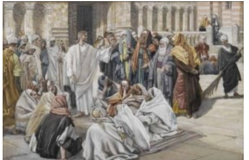
너희는 하느님의 계명을 버리고 사람의 전통을 지킨다. < 마르코 7,1-8.14-15.21-23 >