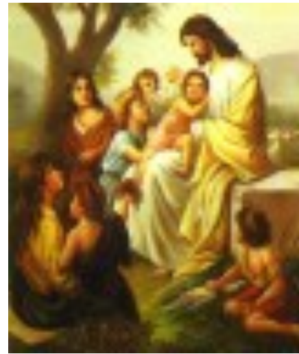
하느님께서 맺어 주신 것을 사람이 갈라놓아서는 안 된다. < 마르코 10,2-16 >

성 가 입당: 414 봉헌: 342/214 성체: 504/502 파견: 270 제 1 독서 창세기 2,18-24 <둘이 한 몸이 된다.> 화 답송 ◎ 주님은 한평생 모든 날에 복을 내리시리라. 제 2 독서 히브리서 2,9-11 <사람들을 거룩하게 해 주시는 분이냐 거룩하게 되는 사람들이나 모두 한 분에게서 나왔습니다.> 복음환호송 ◎ 알렐루야. ○ 우리가 서로 사랑하면 하느님이 우리 안에 머무르시고 그분 사랑이 우리에게서 완성되리라. ◎ 알렐루야. 복 음 마르코 10,2-16 <하느님께서 맺어 주신 것을 사람이 갈라놓아서는 안 된다.> 영 성 체 송 당신을 바라는 이에게, 당신을 찾는 영혼에게 주님은 좋으신 분.