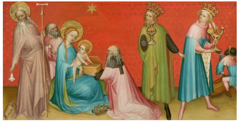
우리는 동방에서 임금님께 경배하러 왔습니다. < 마태오 2,1-12 >

성 가 입당: 444 봉헌: 210 성체: 152/158 파견: 100 제 1 독서 이사야서 60,1-6 <주님의 영광이 네 위에 떠올랐다.> 화 답 송 ◎ 주님, 세상 모든 민족들이 당신을 경배하리이다. 제 2 독서 에페소서 3,2.3.5-6 <지금은 그리스도의 신비가 계시되었습니다. 곧 다른 민족들도 약속의 공동 상속자가 된다는 것입니다.> 복음환호송 ◎ 알렐루야. ○ 우리는 동방에서 주님의 별을 보고 그분께 경배하러 왔노라. ◎ 알렐루야. 복 음 마태오 2,1-12 <우리는 동방에서 임금님께 경배하러 왔습니다.> 영 성 체 송 우리는 동방에서 주님의 별을 보고, 예물을 가지고 그분께 경배하러 왔노라.