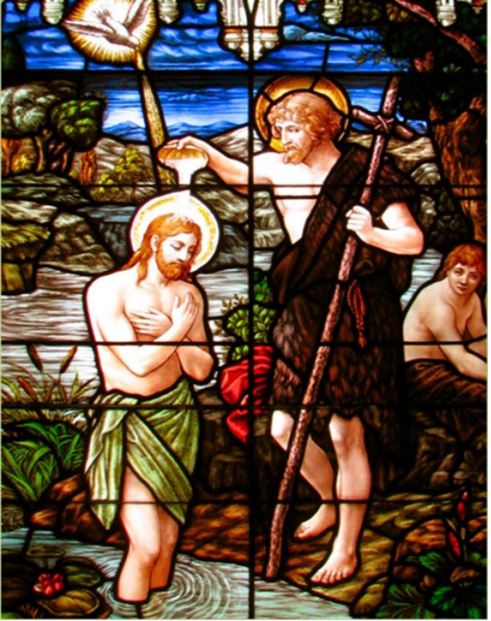
예수님께서 세례를 받으시고 기도를 하시는데, 하늘이 열렸다. < 루카 3,15-16.21-22 >

성 가 입당: 454 봉헌: 212 성체: 153/159 파견: 1 제 1 독서 이사야서 42,1-4.6-7 <여기에 나의 종이 있다. 그는 내 마음에 드는 이다.> 화답송 ◎주님이 당신 백성에게 강복하여 평화를 주시리라. 제 2 독서 사도행전 10,34-38 <하느님께서 예수님께 성령을 부어 주셨습니다.> 복음환호송 ◎ 알렐루야. ○ 하늘이 열리고 하느님 아버지의 목소리가 들려왔네. 이는 내가 사랑하는 아들이니 너희는 그의 말을 들어라. ◎ 알렐루야. 복음 루카3,15-16.21-22 <예수님께서 세례를 받으시고 기도를 하시는데, 하늘이 열렸다.> 영성체송 보라, 요한이 말하였다. 나는 보았다. 그래서 이분이 하느님의 아드님이시라고 증언하였다.